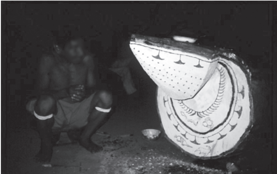
Figura 2. Ojuo'daa, el dueño de las aguas, quien, transformado en canoa de fermentación, presta su vientre para depositar el sari que se consumirá en la fiesta