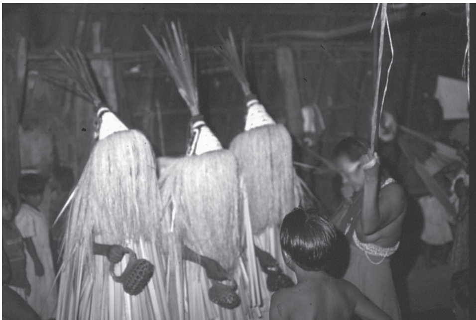
Figura 3. La mujer responde a los warimes y cuenta su historia