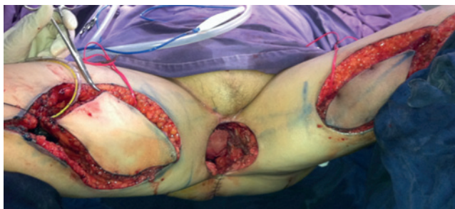
Figura 3 Islas de piel de ambos colgajos musculocutáneos de grácilis.

cual quedó en contacto con la malla. El derecho se dispuso obliterando el resto del espacio muerto y su isla de piel para reemplazar el defecto de piel resultante de la resección (figs. 5 y 6).