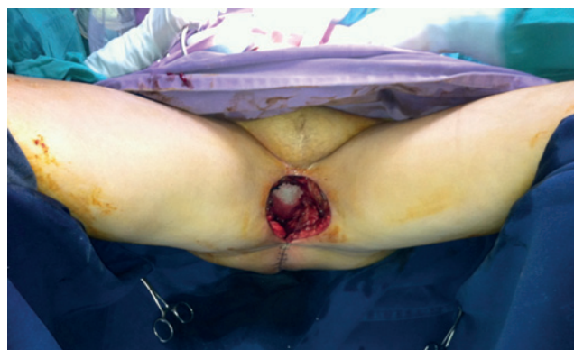
Figura 2 Defecto inmediato posresección. En el fondo del defecto, se aprecia malla que sostiene contenido de cavidad abdominal.