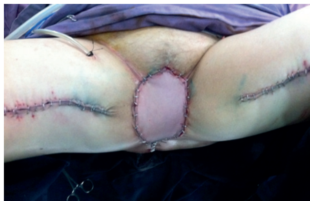
Figura 6 Imagen de colgajo musculocutáneo de grácilis derecho para cobertura de defecto de piel.

El músculo grácilis tiene una irrigación constante que hace que sea un colgajo confiable. Posee perforantes que alimentan en su eje la isla de piel suprayacente, proporcionando un