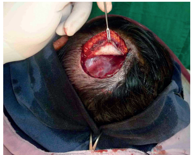
Figura 2 Resección del tumor con margen lateral de tejido sano de 1,5 centímetros, incluyendo en profundidad la fascia temporal superficial.

Existe una propuesta para agrupar los tumores pilares proliferantes en tres grupos, correlacionando los hallazgos histológicos con el potencial de malignidad. El primer grupo