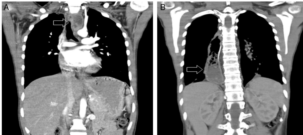
Figura 1 A: TAC del tórax al diagnóstico. La flecha indica la lesión ulcerada con realce del medio de contraste en la pared derecha del tercio medio del esófago cercana a la bifurcación de la carina con estriación leve de la grasa del mediastino posterior adyacente. B. TAC del tórax posterior a neoadyuvancia y control local. Se observan cambios postquirúrgicos de esofagectomía; la flecha muestra el ascenso gástrico.