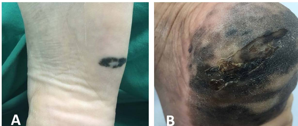
Figura 1. Presentación clínica del melanoma acral lentiginoso en región plantar.

El MLA se presenta en forma clásica como máculas o parches irregularmente pigmentados, con tonos de color entre pardo y negro (Figura 1).