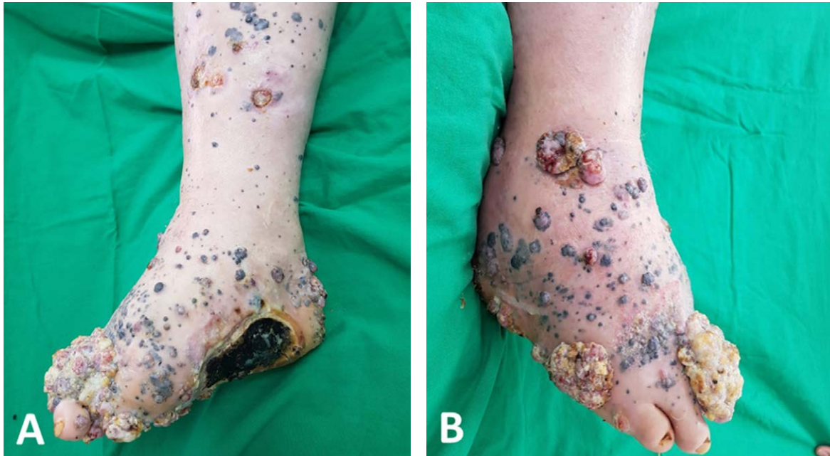
Figura 2. Melanoma acral lentiginoso con metástasis en tránsito. En A y B se observa ausencia de primer artejo asociado a extensa placa de aspecto tumoral, comprometiendo aspecto dorsal y plantar del pie derecho, con múltiples lesiones nodulares satélites pigmentadas.

El MLA de aparición en zonas no subungueales se caracteriza por iniciar como una mácula atípicamente pigmentada, con bordes irregulares de crecimiento progresivo; con el avance en el crecimiento vertical, la lesión comienza a elevarse generando pápulas o placas sobre la mácula inicial, en algunos casos ulcerándose (68, 69) (Figura 2).