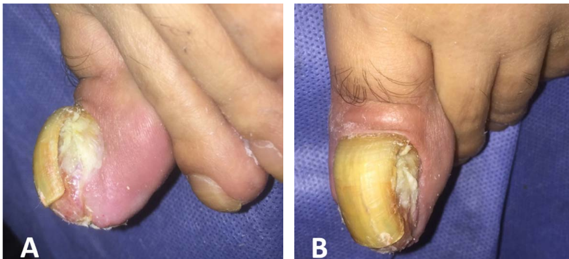
Figura 4. Melanoma Amelanótico. Nódulo tumoral exofítico sobre lecho ungueal en primer artejo de pie izquierdo, el cual desplaza la lámina ungueal y genera distrofia y deformidad a este nivel.

dado que éstas suelen confundirse con otras condiciones como micosis, lesiones traumáticas, nevus acrales, infecciones, queratoacantomas e incluso tilosis en casos de melanomas amelanóticos (68-70) (Figura 4).