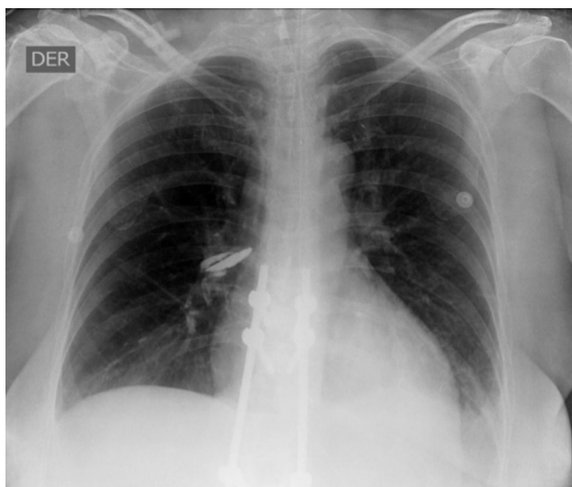
Figura 4 Radiografía de tórax en la que se aprecia obliteración del ángulo costo-diafragmático izquierdo, sugestivo de derrame pleural de apariencia libre. Catéter venoso central. Tubo traqueal central en posición adecuada.

tórax rutinaria después del procedimiento para la detección precoz de embolia pulmonar por cemento 14 .