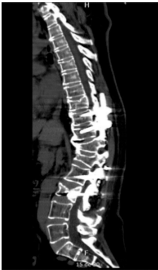
Figura 1 Tomografía computarizada de columna vertebral, corte sagital, en la que se evidencian tornillos transpediculares en vértebras torácicas 10 - 11 y lumbares L2 - L3; hipercifosis residual a nivel de fractura por acuñamiento en los cuerpos vertebrales T12-L1; disminución de la altura del cuerpo vertebral L3; espondilosis de columna torácica y lumbar y disminución de la matriz ósea.

arteria pulmonar 61 mmHg); dada la evolución favorable de la paciente se trasladó nuevamente a habitación en piso y se ordenó radiografía de tórax de control (fig. 4).