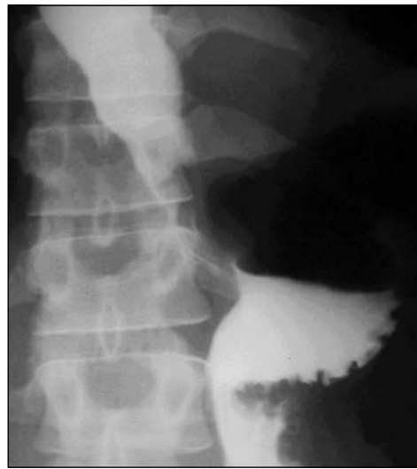
FIGURA 3. Esofagograma al quinto día posoperatorio. No hay escape del medio de contraste.