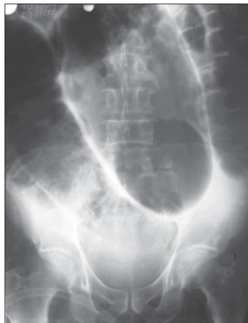
FIGURA 4. Radiografía simple de abdomen en paciente con vólvulo del sigmoide, obsérvese la imagen en “grano de café”.