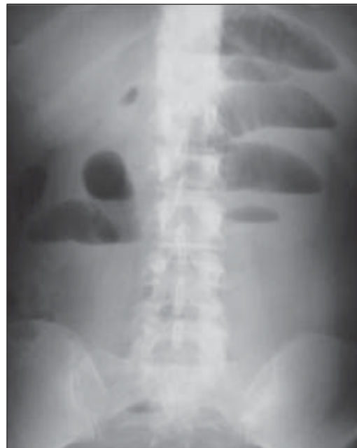
FIGURA 3. Radiografía simple de abdomen en paciente con obstrucción por bridas. Obsérvese dilatación de asas delgadas, imagen en “pila de monedas” y niveles hidroaéreos en escalera.

La realización de estudios de laboratorio como el hemograma, los electrolitos y los gases arteriales son de ayuda puesto que permiten conocer el estado hidroelectrolítico y ácido-base del anciano.