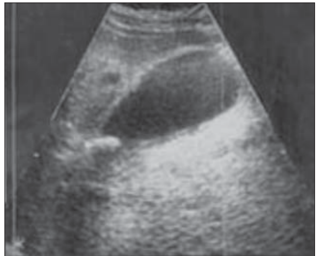
FIGURA 2. Ecografía de vesícula biliar. Se observa con paredes engrosadas (colecistitis) y cálculo enclavado en la ampolla de la vesícula (colelitiasis) con su respectiva sombra acústica.

El procedimiento diagnóstico de elección es la ecografía de hígado y de vías biliares, la cual tiene buena sensibilidad diagnóstica para la colelitiasis, aunque resulta limitada en pacientes con inflamación aguda, por fortuna la mayoría; 90% de los casos de colecistitis es secundaria a colelitiasis (figura 2) (40) .