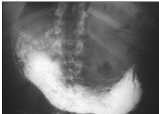
FIGURA 3. Vías digestivas altas. Adecuado paso del medio de contraste a través del esófago, sin presencia de hernia hiatal, cámara gástrica distendida y retraso en el vaciamiento gástrico, con desviación hacia la izquierda del antro pilórico; éste se controla, aproximadamente, una hora después, sin que se observe paso del medio de contraste hacia el duodeno. Se consideró como diagnóstico un síndrome pilórico.

Dos horas más tarde, se examinó nuevamente al paciente y se evidenciaron hallazgos compatibles con abdomen agudo, sin episodios de emesis y con imposibilidad para pasar la sonda nasogástrica. Se con-