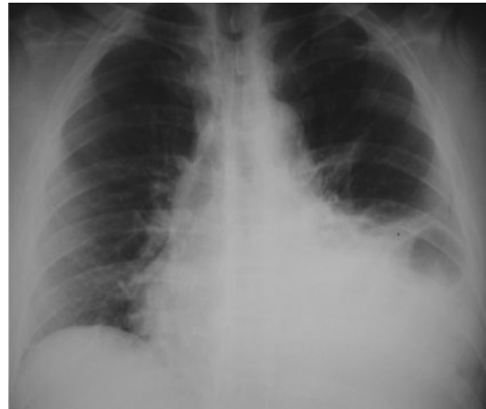
FIGURA 1. Radiografía de tórax. Ángulo costofrénico izquierdo obliterado por la presencia de líquido pleural; no se descarta hernia diafragmática.

Acudió al Servicio de Urgencias del Hospital Universitario de La Samaritana en Bogotá (Colombia), a donde ingresó con distensión abdominal y disminución de los ruidos intestinales; no tenía antecedentes médicos, quirúrgicos ni de trauma. Se inició el manejo con líquidos endovenosos. El cuadro hemático fue normal y la ecografía abdominal demostró líquido libre en la cavidad peritoneal. Se tomó una radiografía de tórax (figura 1) que sugirió una hernia diafragmática.