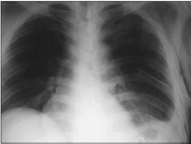
FIGURA 4. Radiografía de tórax (control postquirúrgico). Derrame pleural izquierdo escaso, con tubo de toracostomía cerrada en el hemitórax izquierdo, y enfisema subcutáneo; el aspecto anatómico de las estructuras está dentro de los límites normales.

Se procedió a practicar gastrectomía subtotal con reconstrucción en Y de Roux y herniorrafia diafragmática con sutura de material no absorbible, paso de sonda con punta de tungsteno y colocación de tubo en el tórax izquierdo. Se obtuvo radiografía de tórax de control postquirúrgico (figura 4) con adecuada reexpansión pulmonar.