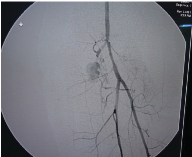
Figura 1. Lesión de arteria tibial anterior con sangrado activo y pseudoaneurisma

Los pacientes se siguieron clínicamente y con ecografía doble ( duplex scanning ) al tercero y al sexto mes después del procedimiento.