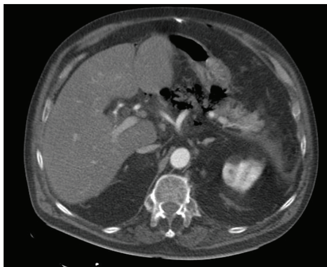
FIGURA 1. Desestructuración de la cabeza del páncreas

enfisematosa. La TC abdominal demostró abundante aire en la celda pancreática y en el conducto de Wirsung y discreto neumoperitoneo y otros signos de pancreatitis enfisematosa. Se inició tratamiento con antibiótico de amplio espectro (meropenem), pero ante el empeoramiento del estado clínico y shock séptico, se decidió intervención quirúrgica. Se encontró una pancreatitis aguda necrohemorrágica extensa, con gas, colecciones retrogástrica y supramesocólica y necrosis grasa extensa, ascitis y gran edema de la cabeza del páncreas. Se realizó desbridamiento extenso y se colocaron drenajes para lavado, optando por laparostomía con “bolsa de Bogotá.” 61,62 El paciente desarrolló síndrome de respuesta inflamatoria sistémica y falla multiorgánica resistente,