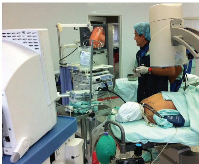
FIGURA 1. Colangiopancreatografía retrógrada endoscópica

El procedimiento se llevó a cabo en una sala de cirugía convencional, con el paciente bajo anestesia general con intubación orotraqueal y en decúbito prono. El endoscopista inició la colangiopancreatografía retrógrada endoscópica, con apoyo imaginológico con brazo en C, en una mesa quirúrgica traslúcida y con endoscopio de visión lateral (figura 1). En caso de que el endoscopista