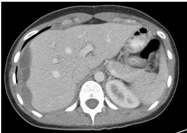
FIGURA 1. Tomografía axial de abdomen con contraste: múltiples imágenes lobuladas de contornos bien definidos y con densidad entre 20 y 40 UH, las cuales tienden a confluir y dan aspecto irregular al contorno del parénquima hepático.

En laparoscopia diagnóstica se encontraron importantes adherencias al diafragma de la superficie hepática superior y posterior, y en el ligamento triangular, se resecó un nódulo endometriósico de 15 mm de diámetro. El fondo de saco de Douglas estaba obliterado en el 50 %, por focos de endometriosis. Dos terceras partes de ambos ovarios presentaban adherencias a la cara posterior del ligamento ancho. Las trompas uterinas no tenían adherencias; la derecha era permeable y la izquierda no lo era. Se resecó un pequeño nódulo paratubárico de 3 mm de diámetro, como también, otros nódulos endometriósicos en los repliegues vésico-uterino y recto-vaginal, y en los ligamentos útero-sacos. Además, mediante laparotomía subcostal derecha, se resecaron seis nódulos de