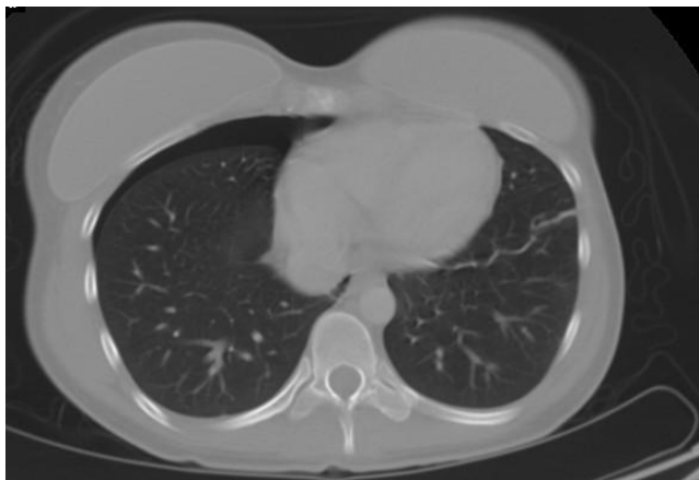
FIGURA 2. Tomografía axial de abdomen con contraste: neumotórax anterior derecho