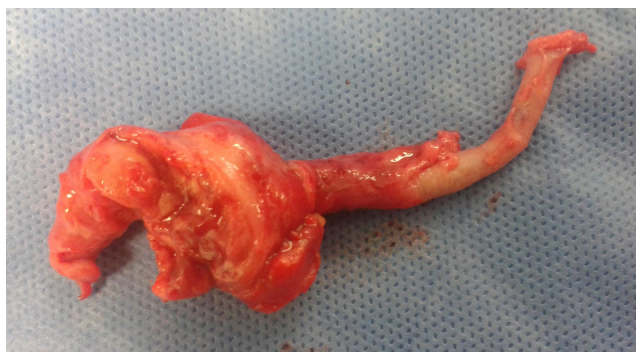
FIGURA 1. Apéndice cecal con apendicitis aguda y absceso. Nótese la fibrosis circundante.

El paciente presentó una adecuada evolución posoperatoria, por lo que se dio de alta con tratamiento antibiótico ambulatorio al día siguiente del procedimiento. El diagnóstico histopatológico fue apendicitis aguda purulenta y tejido adiposo con reacción crónica granulomatosa de tipo cuerpo extraño. El paciente fue valorado por consulta externa dos meses después de la cirugía. Se encontró en buenas condiciones y sin evidencia de hernias inguinales.