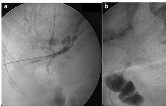
Figura 1. (a) Colangiografía transparieto-hepática derecha (instrumentación biliar percutánea). (b) Punción del asa desfuncionalizada e inyección de medio de contraste.

avance de la pinza laparoscópica y captura de la guía biliar ( rendezvous ). Posteriormente se exterioriza la guía, se fija el asa a la pared abdominal y se avanza el catéter trans-anastomótico (figura 2). Dos semanas después se colocó un stent biliar metálico vía percutánea y se continuó con el tratamiento médico oncológico.