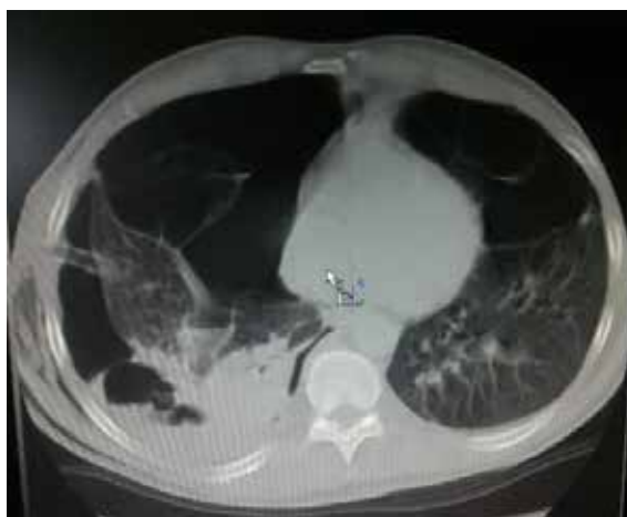
Figura 2. Tomografía computarizada de tórax en la que se observa escaso parénquima pulmonar, con múltiples bullas de diferentes tamaños localizadas en ambos campos pulmonares, algunas de ellas con niveles hidroaéreos en su interior en la base del hemitórax derecho. También, se observa moderado colapso pulmonar derecho.

Según su etiología, un neumotórax puede clasificarse como espontáneo, traumático o iatrogénico.