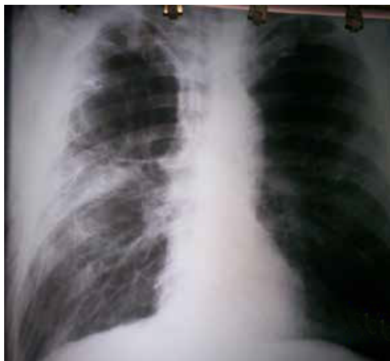
Figura 3. Radiografía de tórax, postero-anterior y en bipedestación, en la que se aprecia la reexpansión del pulmón derecho, además de múltiples bullas enfisematosas en ambos campos pulmonares.

El neumotórax espontáneo aparece sin ningún traumatismo previo y se puede subclasificar como primario, cuando no hay enfermedad pulmonar subyacente, o como secundario, cuando sí la hay 8 .