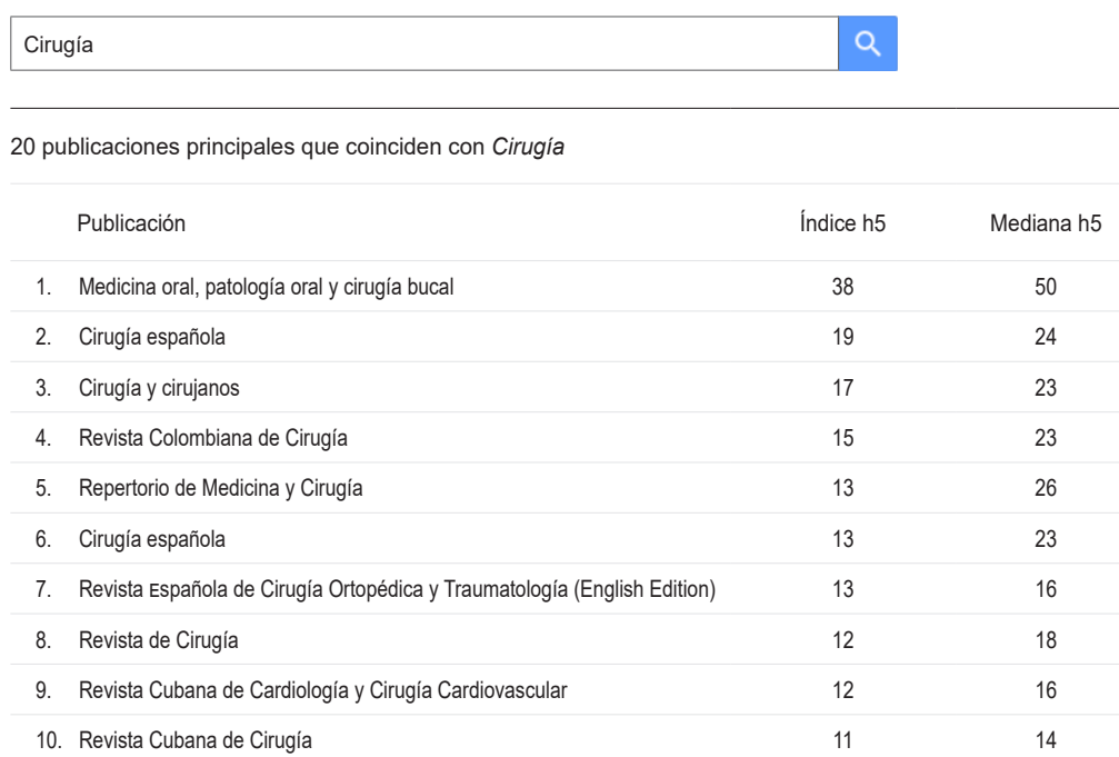
Figura 3. Listado de publicaciones seriadas con el término “ Cirugía ” en la estrategia de búsqueda. Fecha de consulta: 15 de noviembre de 2023.