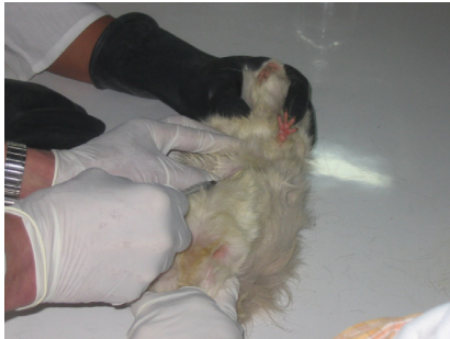
Figura 1. Extracción de sangre mediante punción cardíaca.