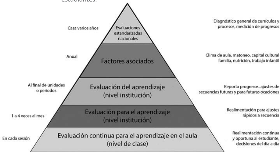
Figura 1. Pirámide de evaluación basada en los aprendizajes de los estudiantes.

En la figura 1 se ilustra una posible pirámide de evaluación que puede introducir a una institución educativa en una cultura de evaluación y de toma de decisiones con base en los aprendizajes de los estudiantes (Loucks-Horsley, Stiles, Mundry, Love & Hewson, 2010).