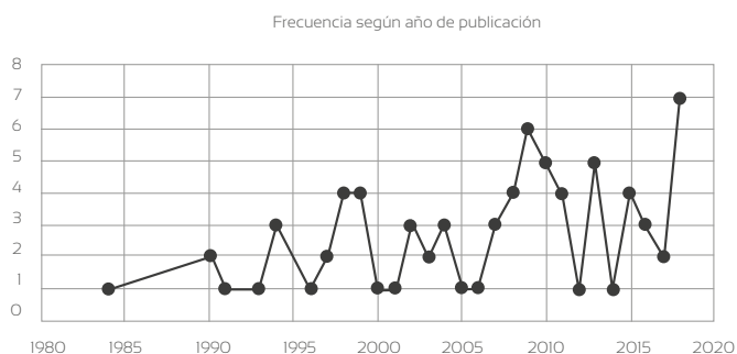
Figura 1. Caracterización de fuentes documentales por año de publicación

De acuerdo con el año de publicación los documentos seleccionados cubren un periodo de 1984 a 2018. La más alta frecuencia se encuentra en el 2009 (6 documentos) y el 2018 (7 documentos), los otros años correspondientes al periodo analizado varían entre frecuencias 1 a 5 documentos por año (véase figura 1).