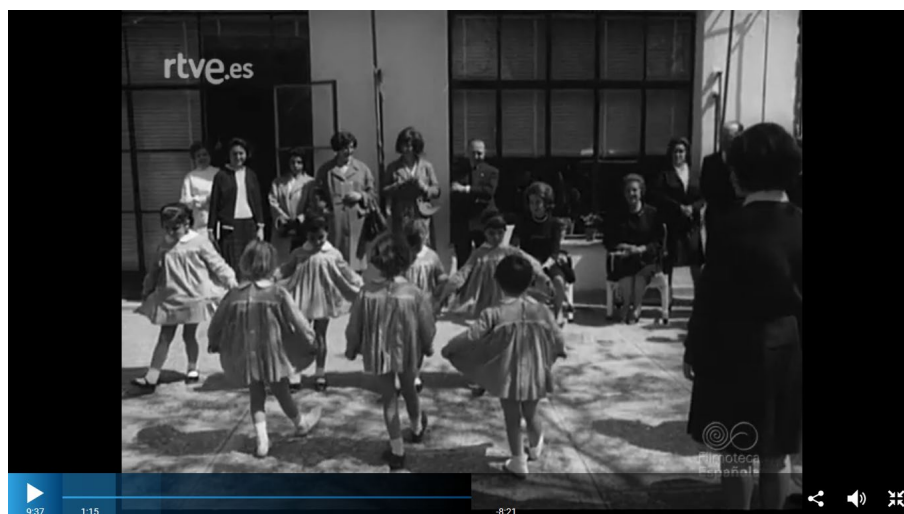
Figura 5. Niñas realizando una demostración de danza ante la princesa Sofía.

La gimnasia era otro elemento esencial para favorecer el desarrollo de los niños (figura 5), aunque esta actividad solo fue mencionada en dos noticias. En una se resaltaba que el ejercicio y el sol abrían el apetito de los más pequeños (Revista de Imágenes, La semilla: una obra de Auxilio Social , 01/01/1965), y en la otra que las acogidas (250 niños y niñas que permanecían allí hasta los 7 años) en la Guardería Nuestra Señora de los Ángeles hicieron una demostración de ejercicios gimnásticos y de pasos de danza ante la princesa Sofía de Grecia y sus acompañantes (noticiario n.º 1111B, 20/04/1964). Por último, encontramos la hora de la comida donde los niños disfrutaban de los alimentos que les ofrecían en los comedores de las instituciones. "Alegres y luminosos comedores [componían] el ámbito donde se les [servía] la alimentación sana y adecuada" (Revista de Imágenes n.º 611, 01/01/1956). El buen apetito de los acogidos era un tema principal de este tipo de noticias debido a la situación de pobreza y de hambruna que vivía España desde el final de la guerra.