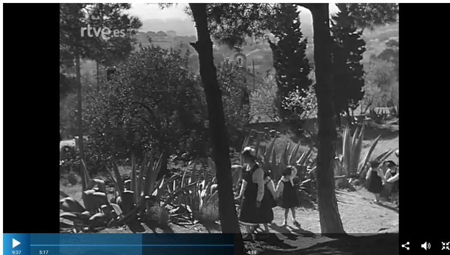
Figura 7. Niñas del hogar infantil de los Montes de Montcabrer paseando por el monte.