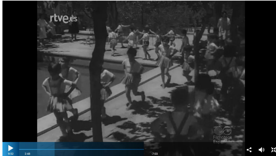
Figura 9. Niños y niñas de un hogar infantil de Auxilio Social “descubriendo la eurtimia a través del juego”.