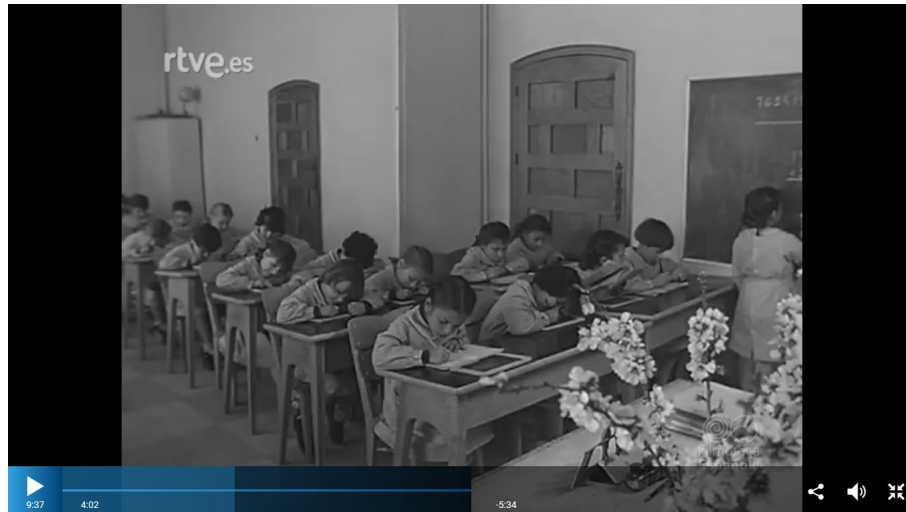
Figura 8. Niñas del hogar infantil de los Montes de Montcabrer resolviendo problemas de cálculo.

Anteriormente hemos mencionado que se afirmaba que estos centros se regían por pedagogías basadas en Montessori, Froebel y Decroly, aunque en las imágenes de este número apreciamos que la metodología imperante en el aula era la tradicional, es decir, niñas sentadas en sus pupitres resolviendo cuentas o problemas, o leyendo y escribiendo en libretas pautadas. Si revisamos las normas de educación e instrucción dictadas por la Asesoría Nacional de Pedagogía vemos que en la etapa de 5 a 7 años se incluían aprendizajes memorísticos lo que nos lleva a pensar que, al final, una vez superados los 5 años, el juego pasaba a ser un elemento secundario en el aprendizaje de las niñas y de los niños a pesar de que NO-DO lo seguía nombrando como un elemento central en estos centros, aunque no podemos afirmar esta hipótesis, pues los números cinematográficos que NO-DO emitió sobre estos hogares son escasos (figura 8).