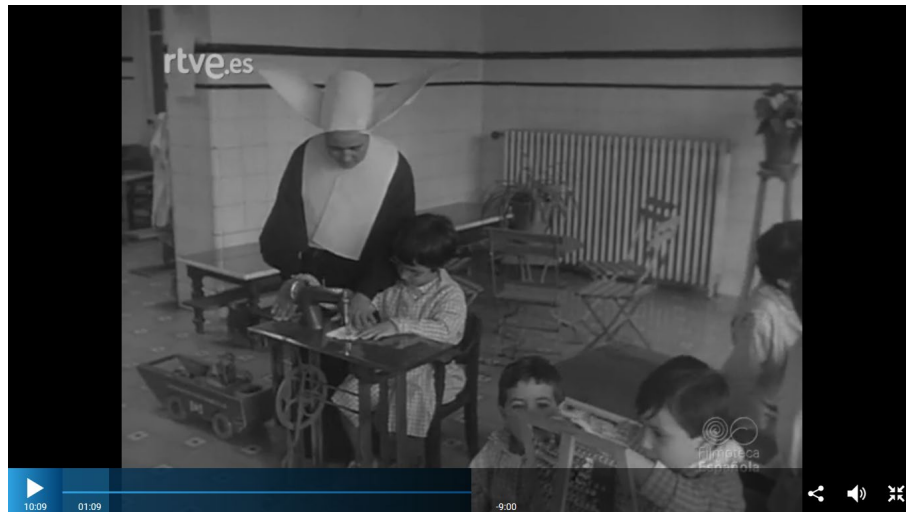
Figura 1. Niña de la casa del niño de Bermeo aprendiendo a coser a máquina.

alimentaban y educaban poniendo a su disposición juegos (ábaco, columpios, casas de muñecas, coches...) y distracciones. A las niñas más mayores les enseñaban a coser a máquina (figura 1). En el documental Míster Rosemberg visita España (01/01/1973) se presentó el Colegio Nacional de la Sagrada Familia de Málaga. Dentro de este complejo también había una guardería donde los niños se desarrollaban en las condiciones ideales gracias al juego y al clima de esta localidad. Los niños estaban atendidos por "religiosas, maestras y personal especializado en puericultura" que favorecían el juego como "método infalible" para aumentar la motivación hacia la enseñanza (Documental en Color Por los hombres del mañana , 01/01/1968).