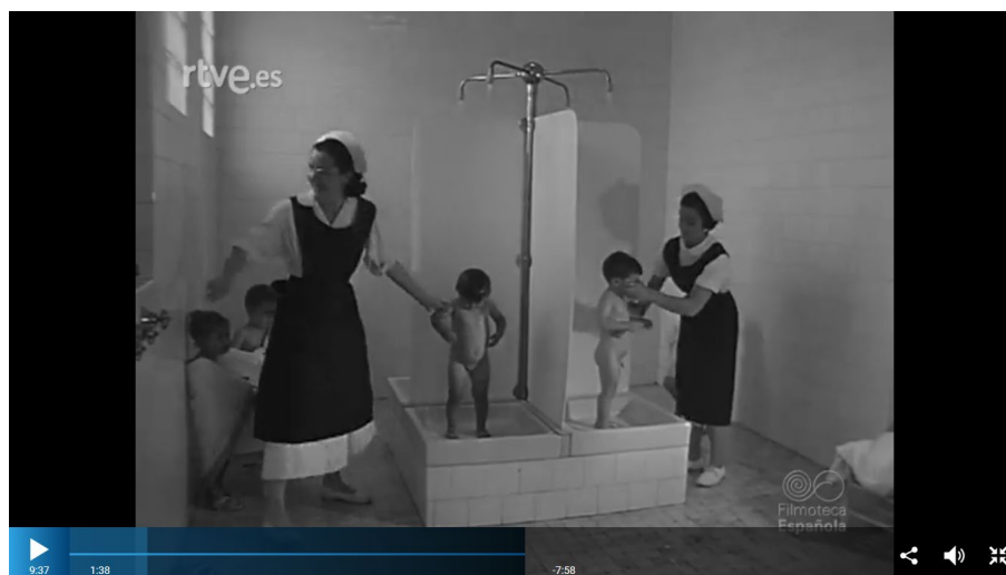
Figura 3. Cuidadoras de la guardería de Tarrasa duchando a los niños.

Estas pedagogías más avanzadas no aparecían explicadas en ningún número, pero sí encontramos, de forma general, las actividades que se ponían en práctica con los niños: “Valorar las cosas buenas y bellas, a concretar las primeras ideas que [bullían] en sus