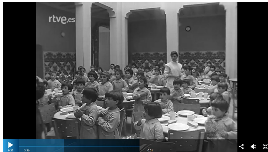
Figura 6. Niñas del hogar infantil de los Montes de Montcabrer rezando antes de comer.

contaba con dos pizarras y en una de ellas una niña se encontraba resolviendo un problema de cálculo. Los pupitres eran para dos alumnas y sobre la otra pizarra, situada detrás de la mesa de la maestra, había un crucifijo. Este no era el único elemento o signo religioso en el centro, pues NO-DO mostró a las niñas rezando antes de empezar a comer (figura 6). La hora del recreo era un momento de expansión y de disfrute para las pequeñas que “jugaban alegres” en los columpios, toboganes, con muñecos o con las cuidadoras. Los paseos por el monte era otra de las actividades principales y características de estos centros, según NO-DO, ya que se fomentaba el ejercicio físico y el que las niñas respirasen aire puro y fresco (figura 7).