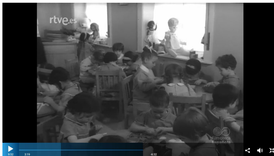
Figura 4. Niños y niñas jugando en sus pupitres.

Sánchez (2008) expone que las actividades pedagógicas que se ponían en práctica en los jardines maternos durante los primeros años (3-5 años) eran ejercicios corporales, ejercicios de activación sensorial, afares lúdicos, adquisición de hábitos elementales e iniciación religiosa, y como medio didáctico se recurrían a los juegos montessorianos, decrolyanos y frobelianos. Para los niños de 5 a 7 años la maestra preparaba ejercicios de actividad sensorial, juegos educativos, ejercicios sensoriales, desenvolvimiento del sentido rítmico, narración de cuentos, dibujo y trabajos manuales, canto, iniciación religiosa e iniciación al lenguaje y al cálculo. Todo ello lo asimilaban a través de juegos de los pedagogos citados, pero también a través de la memorización. Las escenas que NO-DO mostraba en sus noticiarios eran breves y los planos solían ser generales, es decir, abarcaban casi toda la clase, por lo que resulta difícil deducir que materiales estaban utilizando los niños. No obstante, en algunas escenas de las noticias los vemos sentados por grupos y a cada uno realizando una actividad como pintar, jugar con bloques de madera, juegos de memoria... (figura 4).