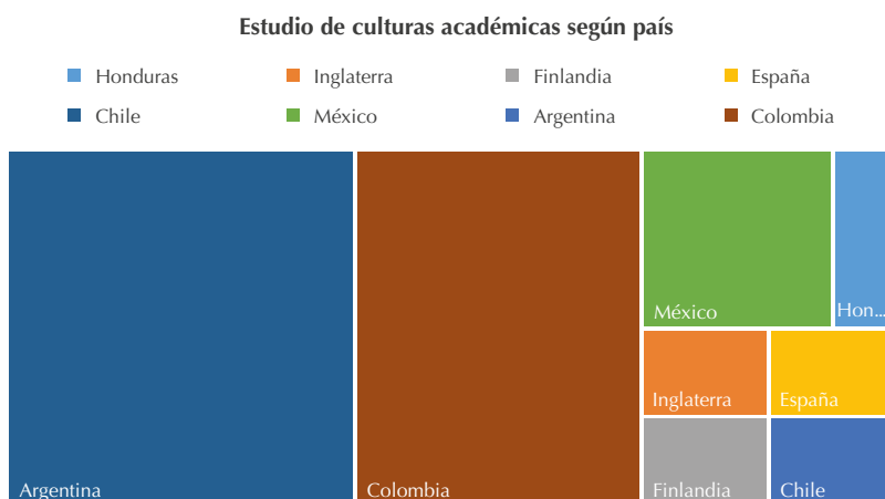
Figura 1. Espacios de mayor producción de conocimiento sobre culturas académicas

de ejes que sustentan las líneas de estudio de las culturas académicas. Paso seguido, fue posible establecer una breve discusión de las tensiones, limitaciones y faltantes de los documentos revisados, que se espera sean suplidos a través de diversas investigaciones en el país. De igual forma, fue posible detallar espacios de publicación; entre los cuales Latinoamérica es pionera con Argentina (que se ha enfocado en ahondar el concepto desde una perspectiva crítica) seguida de Colombia, que se ha inclinado por una línea más de corte comunicativo y sus publicaciones tienden a estudiar la alfabetización académica, más que la cultura como campo de la academia.