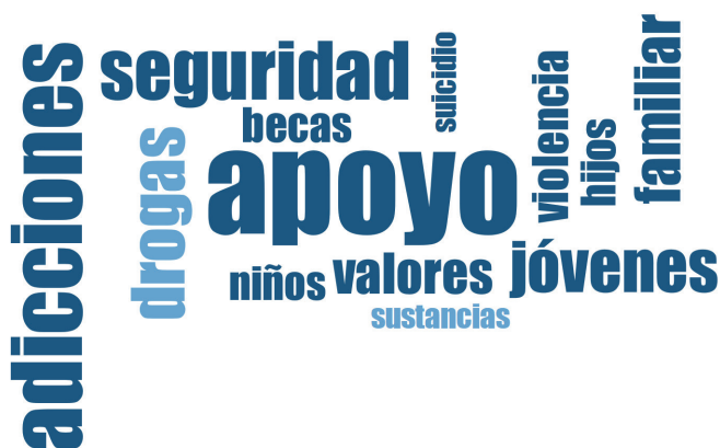
Figura 3. Nube de palabras generada a través de Maxqda2020.