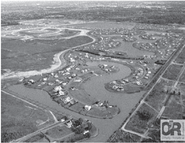
Figura 3. Trama urbana organizada en función de los cuerpos de agua.

estos emprendimientos se halla en función de los lagos, canales y marinas, y se diferencia de toda trama urbana preexistente en la zona (en forma de damero y sin la presencia de los intrincados cuerpos de agua).