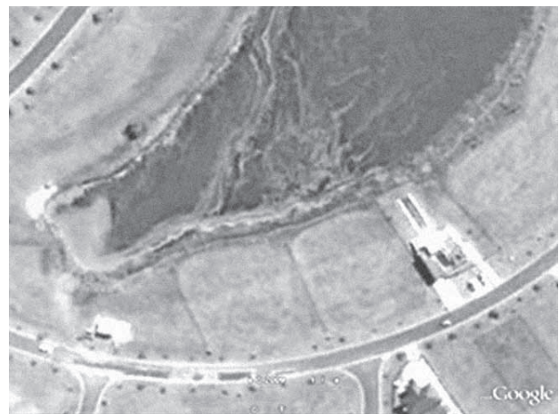
Figura 6. Floraciones algales en lago de San Isidro Labrador (Villa Nueva).

La búsqueda de lagos con formas cada vez más complejas tiene como contrapartida mayores costos en cuanto a su manutención. Ello ocurre en especial con el caso de los espejos de agua confinados en los que se crean condiciones de estancamiento contraproducentes para lograr la oxigenación de las aguas, a lo que se denomina como “aguas muertas” (figura 6). En contraposición, en los lagos de formas más sencillas, con “geografías costeras” menos sinuosas, el efecto del viento favorece el oleaje y con ello la oxigenación de las aguas. Cabe señalar que los lagos confinados tienden naturalmente al aumento gradual de nutrientes que producen un crecimiento excesivo de algas, las que al sucumbir se depositan en el fondo y generan residuos orgánicos que consumen gran parte del oxígeno disuelto, lo que afecta la vida acuática y hasta la muerte de la fauna y la flora. Algunas de las algas que se generan en estos procesos pueden emitir sustancias tóxicas, como, especialmente, ciertas cianófitas, que matan a la fauna del lago e inclusive puede ser peligrosa para la salud humana. Estas algas tienen un color verde azulado, aparecen en el agua como manchas de pintura y emiten un olor a insecticida (Chiodo Llauro y Rodríguez Larreta 2001) 15 . La reproducción de esas algas también se ve favorecida por el aporte de nutrientes derivado de la utilización de agroquímicos para mantener a los céspedes verdes todo el año —especialmente en el caso de las canchas de golf—.