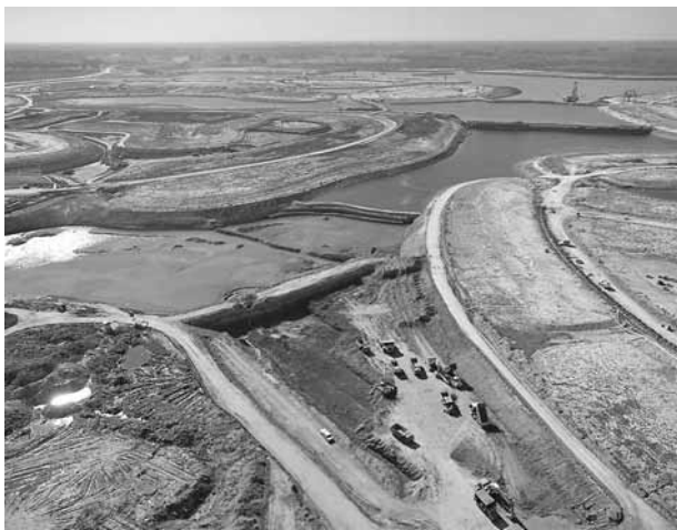
Figura 5. Construcción del lago central de Nordelta.

Los cuerpos de agua de las UC de Tigre presentan formas, dimensiones y profundidades diversas. En cuanto a los lagos, los hay desde pocas hectáreas y escasas profundidades, hasta aquellos que alcanzan gran cantidad de hectáreas y profundidades importantes. Entre estos últimos, el ejemplo más representativo corresponde al gran lago central de la mega UC Nordelta, cuya superficie alcanza más de 180 hectáreas y sus profundidades se encuentran entre los 20 y 30 m (figura 5). Con el paso del tiempo, las formas de los cuerpos de agua de las UC de Tigre han ido cambiando. A comienzos de la década de los noventa, los lagos confinados, marinas y canales de las UC presentaban formas simples; poco tiempo después, aparecieron formas tales como bahías, penínsulas e islas. Ya en los últimos años, los cuerpos de agua empezaron a adoptar formas similares a las del “coral cerebro”, lo que complejizó su geografía de “accidentes costeros” 12 . Al ampliarse las líneas de costa se acrecentó la cantidad de lotes frente a los nuevos cuerpos de agua, con lo que se logró obtener rentabilidades mayores.