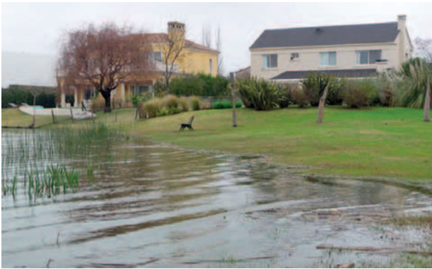
Figura 7. Aumento del nivel de agua de los lagos por precipitaciones.

La creación de los lagos ha generado condiciones ambientales propicias para el arraigo y reproducción de algunas especies animales “indeseables” para los habitantes y desarrolladores de las UC. Este es el caso de los coipos (o nutrias), roedores acuáticos autóctonos de los bañados y de las islas del delta del Paraná, cuyo crecimiento de ejemplares ha sido exponencial en los lagos de las UC, lo que ha causado molestias a los propietarios de los jardines frente al agua, pues realizan cuevas en los bordes de contacto tierra-agua y se alimentan de las raíces del césped. Las gallaretas son otro de los animales “inoportunos” que han afincado en los nuevos cuerpos de agua. El escaso apego que han logrado esas aves acuáticas se debe a que estas se alimentan de gramíneas, y en este caso en particular, de las semillas de césped que se utilizan para la resiembra (se estima que estas aves consumen cerca de la mitad de las semillas empleadas) de los jardines particulares y de las canchas de golf. Además, las excretas de las gallaretas se han convertido en un problema ya que arruinan la estética y el uso de los jardines, accesorios y piscinas.