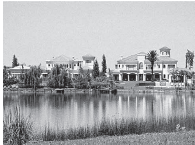
Figura 4. Paisaje de verde y agua del lago central de Nordelta. Fuente: Clarín 2009.

agua se destacan por el valor de cambio diferencial (renta diferencial) que ese elemento les otorga. Según puede compararse tomando los precios de las inmobiliarias de la zona (OTys, María de Tigre, Mieres, etc.), los lotes frente al agua son entre dos y tres veces mayores respecto a los que no se encuentran en esa situación, especialmente, si se confronta los lotes con esa condición paisajística de aquellos sin vista a los cuerpos de agua ubicados en los bordes perimetrales. Tampoco los precios son indiferentes al tipo de agua que se tenga enfrente: los lotes sobre canales y marinas con acceso a cursos de agua abiertos (como es el caso del río Luján) 10 , son mucho más valorados que los que dan a lagos confinados; la diferencia entre unos y otros es de más de un 30% a favor los primeros 11 .