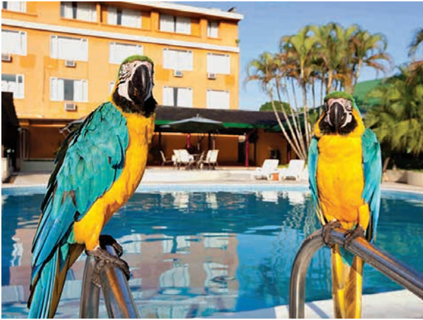
Figura 16. Piscina del Hotel Anaconda, Leticia.

Todas estas comodidades que permiten el aislamiento, la tranquilidad y la seguridad solo se pueden ofrecer a expensas de aquellos que quedan fuera, lo cual en Leticia se torna cada vez más notorio al resaltar que el número de establecimientos hoteleros ha aumentado en años recientes. Leticia y Puerto Nariño 12 pasaron de tener 14 establecimientos de hospedaje en el 2003 a 41 en el 2009 (Ochoa y Aponte 2010, 6) los cuales albergan un número de turistas que se duplicó entre el 2004 y el 2013, pasando de 20.000 a 45.000 (Meisel, Bonilla y Sánchez 2013, 42). Es decir, en el 2013 pasaron por Leticia tantos turistas como habitantes tiene la ciudad. 13