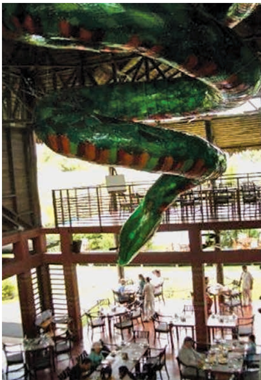
Figura 14. Serpiente de plástico en el Hotel Decameron Tikuna, al interior del restaurante, Leticia.

el paisaje del turismo es abiertamente defensivo para quienes no son compradores de dicho servicio. Como se sugirió con Germán Ochoa (Ochoa y Aponte 2010), una es la ciudad que se construye para la gente, y otra la que se presenta a los turistas escondida tras unos muros. Una ciudad sin ciudadanos, una ciudad para los turistas. Una ciudad, como plantearan Isabel Rodríguez, Casilda Cabrerizo y Eloy Méndez (2011) —haciendo referencia a Roses y Puerto Peñasco, un par de ciudades de turismo de sol y playa, la primera en España y la segunda en México—, que quiere ser imaginada como paraíso, pero que para su funcionamiento requiere “la imaginaria de una trastienda y una tramoya”, donde viven los tramoyeros que mueven el telón de la puesta en escena urbana, lo cual exacerba “la inclinación de la posmodernidad por la simulación y la hiper-realidad, naturalizando la dualidad extrema de la ciudad contemporánea” (Méndez, Cabrerizo y Rodríguez 2011, 296).