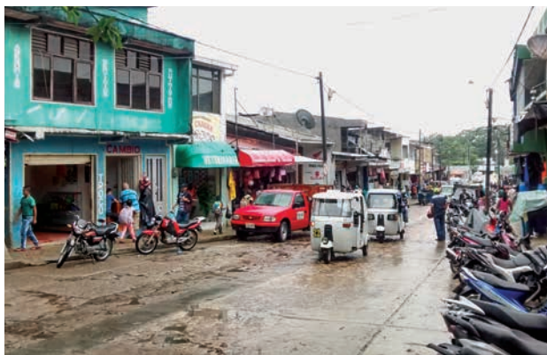
Figura 4. Calles de Leticia. marzo del 2016.

Esta selva imaginada y exótica se hace presente en la promoción del turismo en Leticia. Las calles están llenas de carteles que invitan a hacer recorridos turísticos; incluso, el impuesto al turismo —cobrado a todo aquel que llegue en avión a la ciudad y que no logre probar vínculos residenciales o laborales en ella— convoca, en el desprendible que es entregado tras cancelar dicho impuesto, a conocer tribus indígenas, grandes felinos, paisajes exóticos y a cruzar la frontera; dicho componente se repite en otros documentos institucionales y en los discursos de las agencias de viajes que recalcan las mismas características de un producto construido para presentar lo que el visitante ya esperaba, es decir, los imaginarios salvajes de la Amazonia: indígenas, fauna, flora, río, es decir “la selva”, y el componente diferencial de Leticia, “la frontera”.