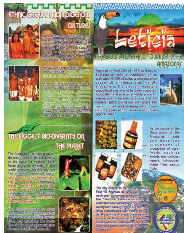
Figura 5. Plegable de promoción turística.

En un plegable (figura 5), editado hace más de diez años por la oficina de turismo de Leticia, se evidencia un discurso que con pocos cambios es plenamente vigente en la publicidad turística sobre la ciudad, como bien lo atestiguan tanto la página web oficial de turismo del Estado Colombiano (Colombia Travel sf), como la del municipio de Leticia (Portal Leticia 2013). El documento, elaborado en inglés, es decir dirigido a turistas anglófonos, evidencia el paquete de ofertas disponibles para el turista. Primero, bajo el título Ethnic Groups and Indigenous Cultures , el texto menciona la existencia de algunos grupos, su ubicación y una alusión a su “riqueza cultural”; todo esto acompañado por un par de imágenes de indígenas estereotipados, puestos “al natural” y viviendo en un tiempo ahistórico, las cuales pueden ser vistas por los turistas como pruebas documentales que corporizan lo que ya habían visto en otros catálogos y lo que esperan encontrar en un viaje “selvático”. Segundo, en The Biggest Bio-diversity on the Planet , otro apartado del texto en cuestión, se comenta la existencia de plantas medicinales, frutales, maderas finas y minerales, así como de animales que representan dicha biodiversidad observable y comprable, para lo cual muestran unas imágenes representativas de tal oferta.