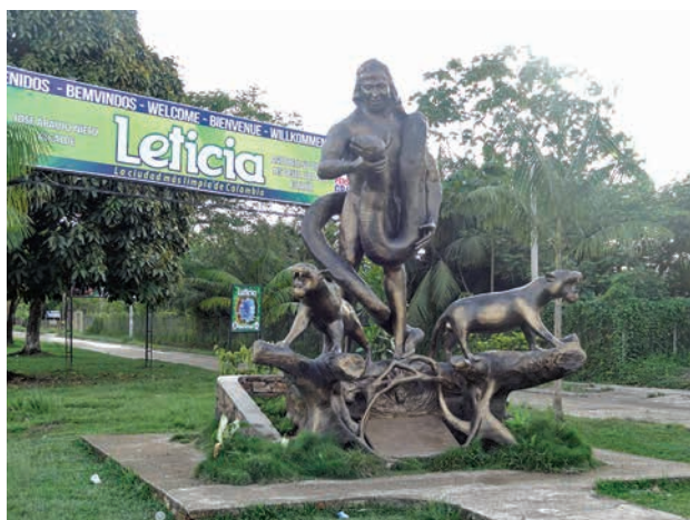
Figura 12. Nueva locación de Estatua Kápax, cabecera de la Avenida Vázquez Cobo frente al aeropuerto, Leticia. noviembre del 2016.

Pese a toda esta construcción simbólica en torno al turismo, la estatua fue removida de este lugar en el 2012 debido a que estaba en riesgo de derrumbarse por debilidad de los cimientos del malecón. La estatua fue rediseñada con un pequeño giro en la mirada de Kápax y la adición de un pedestal que agregó dos fieros felinos al conjunto, los cuales, junto con la anaconda que aferra en sus manos, representan el control del personaje sobre las bestias salvajes. Con dichos cambios, la estatua fue reubicada en la cabecera de la Avenida Alfredo Vázquez Cobo —que comunica al Aeropuerto con el centro de la ciudad—, logrando así ser el primer monumento observable después de salir del aeropuerto (figura 12).