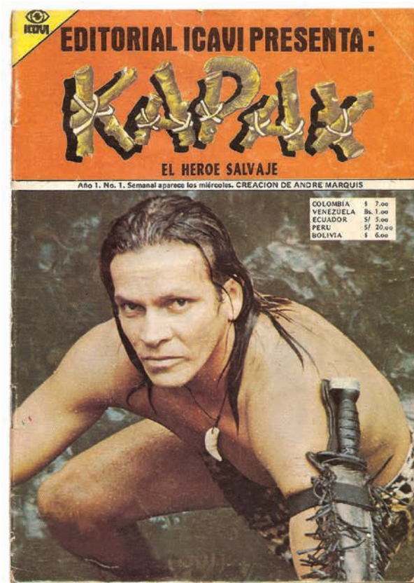
Figura 3. Portada de la fotonovela Kápax. El Héroe Salvaje . Año 1 n.º 2 1977.

Actualmente trabaja para una cadena hotelera internacional y su imagen hace parte tanto de anuncios publicitarios como de estatuas y murales ubicados en diversos lugares de la ciudad. De este modo, se evoca nuevamente una Amazonía imaginada y promovida de forma institucional, en la cual —al igual que Tarzán, el personaje de origen escocés, perdido en su infancia en las selvas africanas—, el héroe protege a la selva de sus posibles agresores, frente a la impotencia de los habitantes selváticos, indígenas o animales, que en dicho relato resultan ser casi lo mismo.