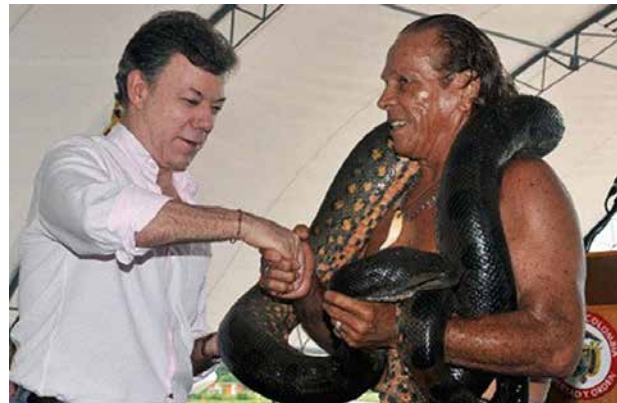
Figura 10. Kápax siendo felicitado por el Presidente de Colombia.

con una estatua de tres metros de alto (figura 11) ubicada en el extremo sur del recientemente construido malecón turístico, un lugar conocido popularmente como el puerto de Mike, en honor a un reconocido comerciante que durante los años ochenta fue asociado con algunas actividades ilícitas y a donde aún llegan —pese a la alta sedimentación del canal del brazo del río Amazonas que pasa por Leticia—, algunas pequeñas embarcaciones con víveres para los mercados locales, así como otras que movilizan turistas. El malecón fue una estrategia —no bien terminada— para ofrecer a los turistas —y no a los habitantes— un paseo por el río, tal como lo hacen otras ciudades portuarias. La estatua de Kápax, que adornaba dicho malecón, representó un referente que, cual Hércules, presidía la ciudad. Esta estrategia intentó servir también para cambiar la toponimia popular del “puerto de Mike” por “puerto de Kapax”, que desde la perspectiva de la Policía Nacional de Colombia, impulsora del proyecto, representaba mejores valores que el recordado comerciante. Sin embargo, tal idea no tuvo buena acogida entre la ciudadanía.