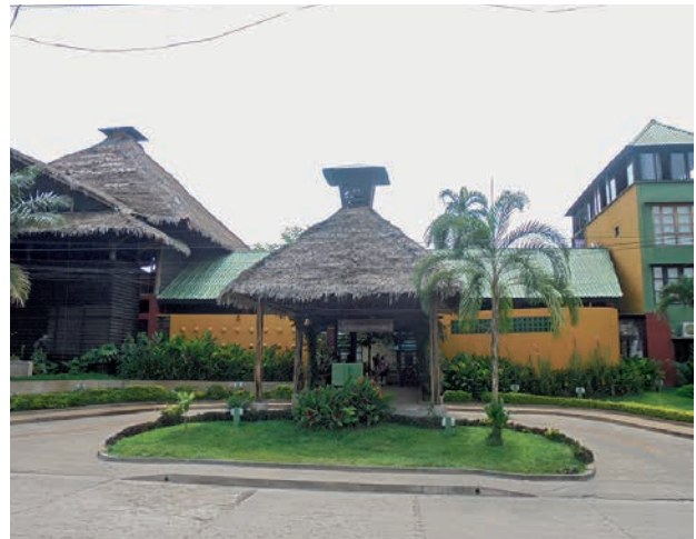
Figura 13. Entrada del Hotel Decameron Tikuna. Carrera 11, Leticia. Fotografía del autor, marzo del 2016.

Pasar por la entrada principal es cruzar el limbo entre la realidad y la fantasía exótica que evocan el vestíbulo del hotel, su bar y una gran piscina. Son dos mundos: uno afuera, el que se vive en la calle, y el del interior, donde regularmente se realizan “presentaciones de danzas, música y canto autóctono”, danzas folclóricas de Brasil y Perú, y donde además puede asistirse al “canto del chamán” tres veces por semana (Decameron 2016). En este complejo turístico incluso se ven anacondas ornamentales de plástico colgadas del techo, como la que está en el centro del restaurante y la cual se divisa desde la calle (figura 14). Este tipo de situaciones logra evocar una selva imaginada y domesticada que puede verse desde la comodidad del hotel, sin que el mundo verdadero y sus incomodidades afecten la tranquilidad de la simulación.