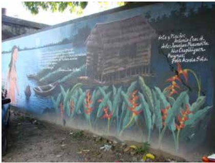
Figura 9. Mural paisajístico 2. Mujer saliendo del agua. Carrera 8, Leticia. agosto del 2008.

La misma idea persiste en otro mural, esta vez sin Kápax pero con el mismo lenguaje de representación paisajística que se repite numerosas veces en los murales que están por toda la ciudad. En la figura 9 se ve a una mujer desnuda, de apariencia indígena, saliendo del agua; hay una construcción en palafito, algunas canoas y flores. Estos son los referentes estereotipados de los selvático y lo amazónico que niegan la realidad presente de la ciudad, su entorno y la situación de las diferentes comunidades indígenas. Este mural, como muchos otros, reproduce el exotismo selvático que anula a la ciudad y que está inmerso en el discurso institucional.