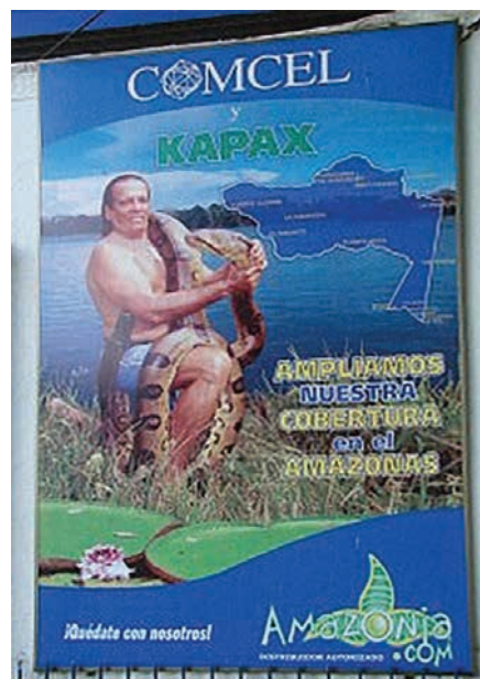
Figura 7. Kápax en la campaña publicitaria Amazonia.com, Leticia. Fotografía del autor, agosto del 2008.

Así mismo, este personaje está en el mural del Parque Central de Leticia —o Parque Santander— (figura 8), donde invita a un indígena a conocer la Selva insinuando que él —Kápax— es su dueño. Se infiere de esta representación que el otro personaje —con una guacamaya en su hombro— recibe las enseñanzas sobre la selva que lo circunda y la cual desconoce, gracias a la sabiduría y experiencia del también conocido como el “Tarzán colombiano”.