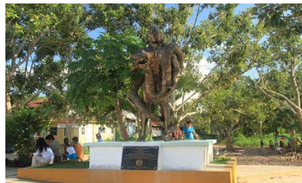
Figura 11. Estatua Kápax en el Puerto Mike Tsalikins, costado sur del puerto de Mike.