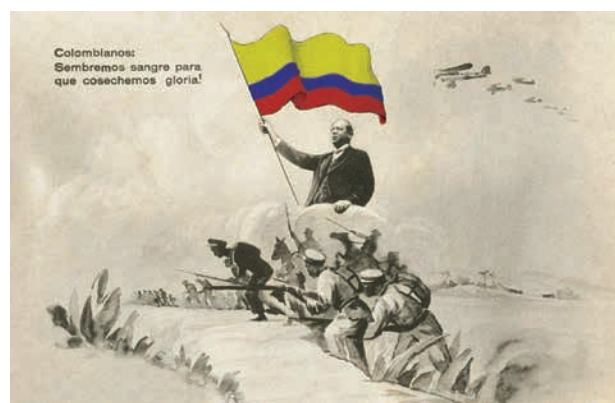
Figura 2. “Colombianos. Sembramos sangre para que cosechemos Gloria”. Enrique Olaya Herrera, Presidente de Colombia. Propaganda oficial en la Guerra Colombo-Peruana 1932-1934.

del supuesto éxito militar que unió a la nación por causa de su defensa— es conocida desde la infancia con las primeras clases de ciencias sociales. Dicha historia habla sobre el patriotismo de la acción militar que condujo a increíbles donaciones de joyas de las señoras de las élites capitalinas, así como a exaltadas declaraciones patrióticas de los gobernantes del momento que hicieron parte de la propaganda en apoyo de la guerra. Por ejemplo, la figura 2 muestra una alegoría a Enrique Olaya Herrera —quien durante la guerra fue presidente de Colombia— con la bandera enarbolada, invitando a “sembrar con sangre” para cosechar la gloria nacional frente a Perú.