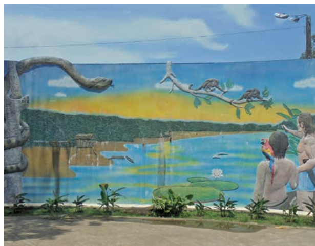
Figura 8. Mural paisajístico 1. Kápax enseñando la Amazonia. Parque Santander, Leticia. noviembre del 2016.