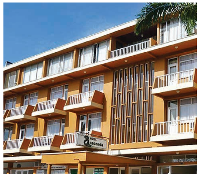
Figura 15. Fachada del Hotel Anaconda, Leticia.

Es importante aclarar que en esta investigación no se está planteando que los hoteles en Leticia hagan algo diferente a lo que hacen otros hoteles en cualquier parte del mundo; solo se sugiere que la arquitectura hotelera está diseñada para segregar a quienes hacen uso de los servicios del hotel —llámense turistas— de quienes no lo hacen. Para los usuarios esto significa un cúmulo de servicios, para el resto no.