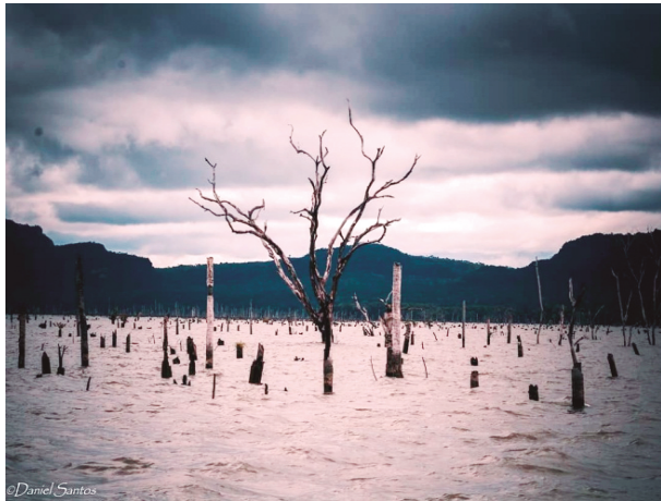
Figura 2. Resquícios da “ilha”: árvores em decomposição no lago da uhee, em Babaçulândia.

Para Diegues (2001), ainda existem representações simbólicas e míticas que vão além das diferentes culturas e das diferentes organizações sociais. Embora as transformações do mundo moderno tenham atingido a natureza de forma exorbitante, cada forma de interação tem sua maneira própria de representar, interpretar e agir sobre o meio natural. Desta forma, Diegues admite que “[...] o território é também o locus das representações e do imaginário mitológico dessas sociedades tradicionais” (2001, 85). A ilha era um lugar favorecido pela natureza, cuja fertilidade era notável, toda forma de recurso e de intimidade com o território hoje está submersa, conforme demonstra a figura 2.