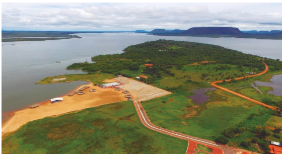
Figura 4. Vista aérea da praia e do calçamento em Babaçulândia: uso dos royalties.

No âmbito de suas construções, as empreendedoras devem considerar relevantes aspectos socioeconômicos no contexto da desterritorialização das populações atingidas. É preciso refletir sobre a região atingida, pois “Cada comunidade, e, dentro delas, os grupos sociais, é regida por um conjunto de capacidades adquiridas, associadas às preferências, relacionamentos, hábitos e comportamentos socialmente padronizados que constituem sua cultura” (Muller 1995, 271).