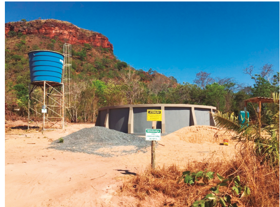
Figura 3. Reservatório de abastecimento de água no reassentamento Baixão.

eles. Informações in loco confirmam que o reservatório (figura 3) tem capacidades para 150.000 litros de água.