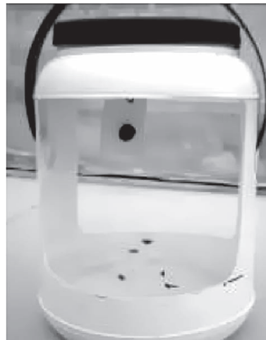
Figura 1. Trampa plástica blanca cebada con volátiles y con agua jabonosa en el fondo.

Preferencia de hembras por estructuras de la planta de papa. Un 44% de las hembras vírgenes de T. solanivora prefirieron el brazo del olfatómetro conteniendo las flores con respecto a las demás estructuras evaluadas y al control, aunque estas preferencias no mostraron diferencias estadísticas (Tabla 1). Para el tiempo de permanencia de las hembras en cada uno de los brazos del olfatómetro, sí se observaron diferencias estadísticas donde hubo una preferencia mayor de las hembras por permanecer en el brazo tratado con tubérculos de papa (Tabla 1).