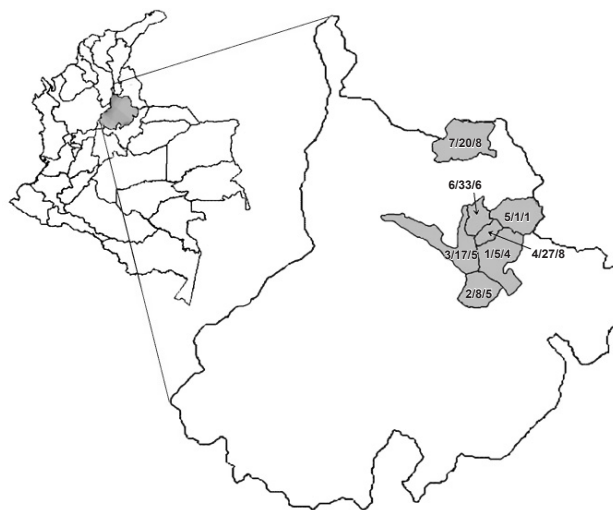
Figura 2. Área del departamento de Santander donde se han recolectado papilionidos. Los números indican: Municipio/ejemplares/especies. 1. Piedecuesta. 2. Los Santos. 3. Girón. 4. Floridablanca. 5. Tona. 6. Bucaramanga. 7. El Playón.

población, mejorar el conocimiento sobre su distribución y sobre el estado de conservación de su hábitat en el departamento de Santander.