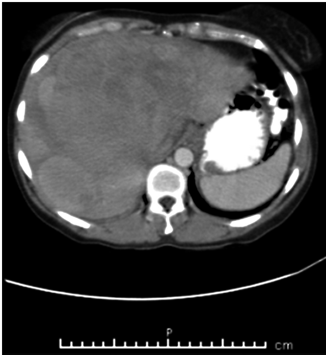
Figura 2. TAC de abdomen contrastado. Hígado con ecogenicidad heterogénea, en el que se observa 3 lesiones de predominio isodenso, con algunas áreas de menor densidad al interior, localizadas en los segmentos 5, 7 y 8 y otras 2 lesiones hacia los segmentos 2 y 7.

dominio isodenso con el parénquima, con algunas áreas de menor densidad al interior, localizada de mayor tamaño en los segmentos 5, 7 y 8, que medían 149 x 128 mm; y otras 2 lesiones hacia los segmentos 2 y 7, con diámetros de 51 y 57 mm; hallazgos que sugieren cambios por proceso neoplásico. El resto de los órganos abdominales se encontraban sin alteraciones ( Figura 2 ).