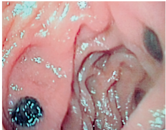
Figura 3. Endoscopia de vías digestivas altas. Duodeno segunda porción. Se observa en el bulbo 2 lesiones hiperpigmentadas de 5 mm.

hemático de hemoglobina ligeramente disminuida 11,9; enzimas hepáticas ligeramente elevadas, TGO: 68, TGP: 54, tiempos de coagulación e INR dentro de parámetros normales. Se le realizó colonoscopia total, la cual reportó hemorroides internas grado II, resto de colonoscopia total normal. Se obtuvo previo consentimiento informado para la elaboración del reporte de caso. La paciente actualmente se encuentra en quimioterapia paliativa y en manejo por medicina del dolor.