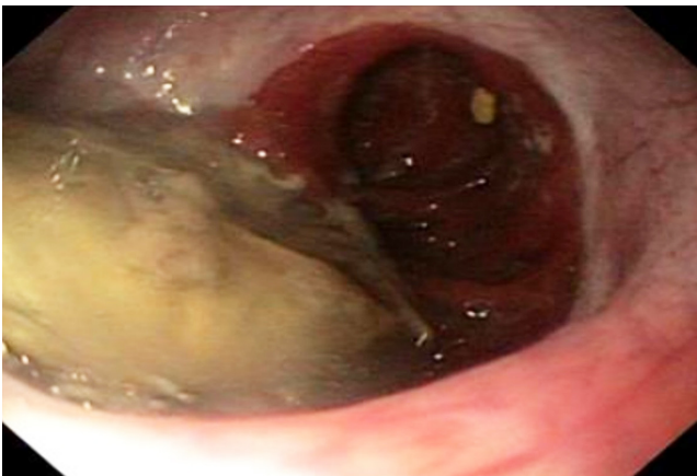
Figura 1. Impactación alimentaria.

Durante el examen físico se evidenciaron signos de deshidratación, sin otros hallazgos positivos. En vista de los antecedentes y los síntomas descritos, se decidió realizar una endoscopia de las vías digestivas altas. En ella se observó una impactación alimentaria a nivel de la anastomosis esofagoyeyunal ( Figura 1 ). Se efectuó la extracción de un cuerpo extraño y se halló una anastomosis, sin signos de recaída tumoral. Sin embargo, se encontró una zona de estenosis del 40 % de la luz, a 10 cm de la anastomosis, con una disminución concéntrica de la luz por un edema circunferencial de la mucosa ( Figura 2 ), lo que permitió el paso del equipo con una ligera resistencia, y se tomaron biopsias de dicha zona.