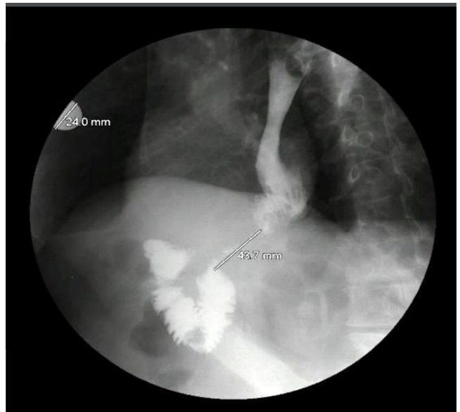
Figura 3. Radiografía de las vías digestivas altas.

El paciente fue evaluado en cirugía gastrointestinal. Allí se consideró que cursaba con una estenosis del asa aferente, en probable relación con una recaída tumoral. En consecuencia, se determinó implementar una dieta licuada, la cual fue tolerada por el individuo. Dado que se observó una evolución favorable, se decidió dar el egreso, a fin de realizar un control ambulatorio mediante el reporte de las biopsias tomadas inicialmente.