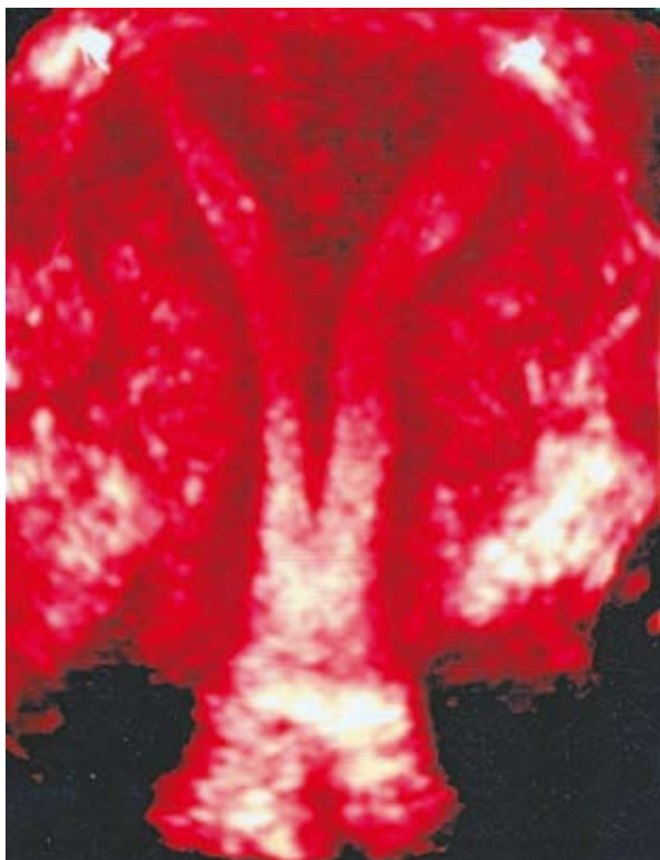
Figura 2. Ausência de divisão de corpo uterino.

normal. Para elucidação diagnóstica, foi solicitada ecografia pélvica tridimensional que evidenciou duplicação cervical ( figura 1 ), septo uterino que se estendia do istmo ao final da cavidade endometrial e ausência de divisão do corpo uterino ( figura 2 ), compatível com útero septado completo e duplicação cervical verdadeira.