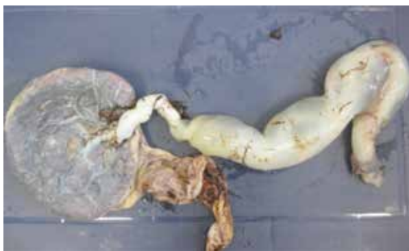
Figura 2. Fotografía de la cara fetal de la placenta, donde se observan los primeros 10 cm de apariencia normal, el resto era de consistencia hidrópica