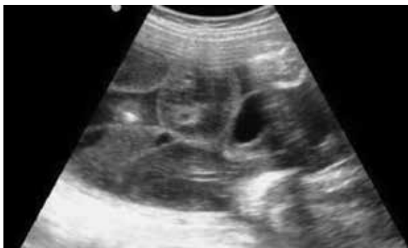
Figura 1. Imagen ecográfica (corte longitudinal) a la semana 29, se observa dilatación del cordón umbilical con edema y pseudoquistes

aparición hidrópica, edematosa, de consistencia más blanda que lo usual, diámetro de 6 cm (figura 2). La placenta fue discoide, con un peso de 600 g, con inserción del cordón umbilical central; se toma muestra del cordón para cariotipo con bandas G. En el examen clínico por el servicio de dismorfología y genética no se encontraron defectos congénitos. El cariotipo fue de 46, XX, con un nivel de resolución de 550 bandas, sin alteraciones estructurales. En la revisión microscópica del CU se observaron los 3 vasos sin alteraciones, edema de la gelatina de Wharton, con cambios mixoides, sin evidencia de epitelio. El diagnóstico fue de pseudoquistes del cordón umbilical (figura 3).