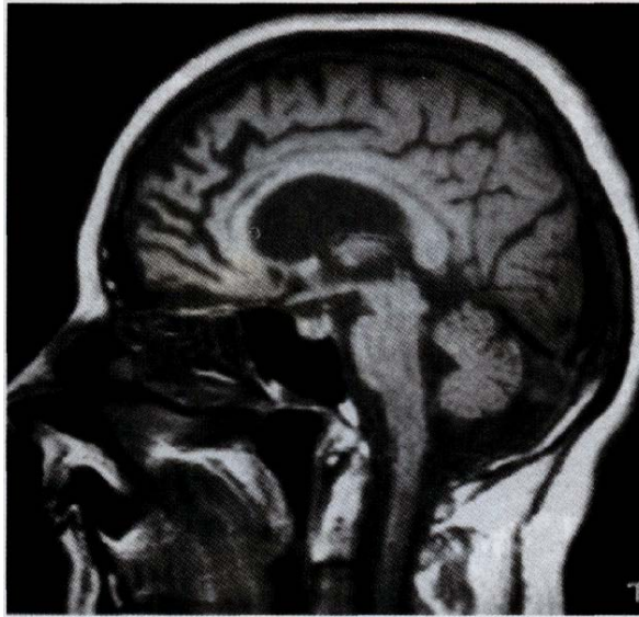
Corte sagital en RMN de encéfalo que muestra acentuada atrofia de las regiones anteriores del cerebro

comparación con pacientes con EA (83) . Una publicación reciente, muestra que la detección del incremento de intensidad de señal por RMN en la sustancia blanca, en fase T2, puede ser un método sensible e incluso específico, que distingue entre DFT y EA (84) .