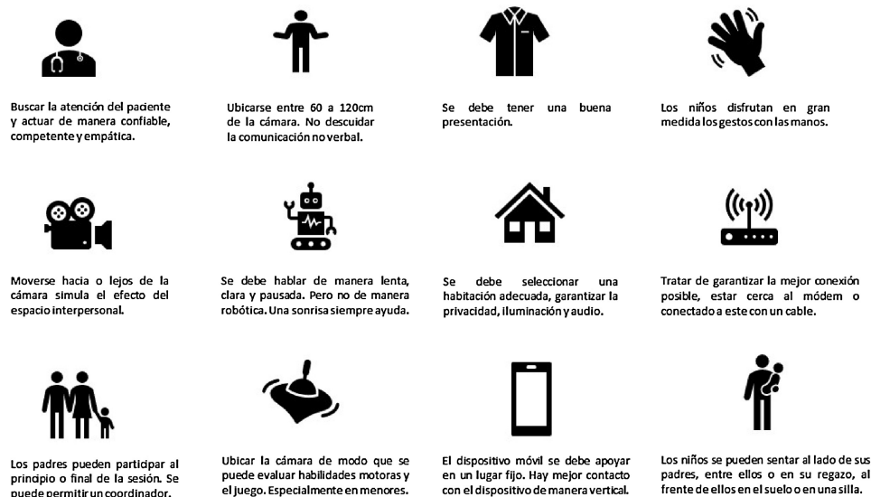
Figura 2 – Consejos prácticos para la atención de telepsiquiatría a niños niñas y adolescentes. Tomado y adaptado de Roth et al. 45 .

ha implementado una estrategia de atención para el público general y personal de salud, brindando primeros auxilios psicológicos, consulta de psicología y psiquiatría tanto a adultos como a población infantil 54 .