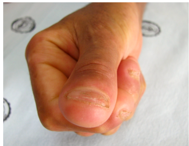
Figura 4. Mejoría del compromiso cutáneo.