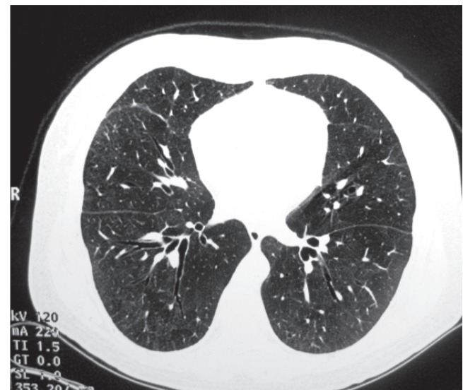
Figura 2. TACAR 6 meses pos-transplante: bronquiectasias de tracción.

La paciente presentó una disminución del score de Rodnan mayor al 50%, con una apertura oral de 4,5 cms. (Figuras 2 y 3), cambio significativo del compromiso pulmonar dado por mejoría en la escala de disnea a grado I/IV, resolución del patrón restrictivo en las pruebas de función pulmonar, TACAR control con ausencia de infiltrados intersticiales y presencia de bronquiectasias de tracción; no evidencia de HTP por ecocardiografía. (Tabla 2) - (Figura 2)