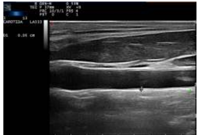
Figura 1 – Imagen ecográfica que muestra el grosor de la íntima-media carotídea tomada con el método convencional.

Convencionalmente, la medición del grosor de la íntima-media se lleva a cabo por el trazado manual de las interfaces entre las capas de tejido arterial (fig. 1). Cabe destacar que este