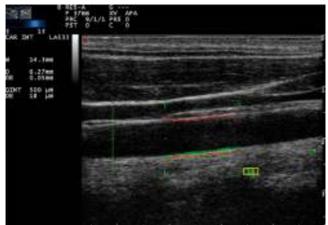
Figura 2 – Imagen ecográfica que muestra el grosor de la íntima-media carotídea tomada con el método automatizado basado en radiofrecuencia.

Recientemente, la técnica de ultrasonido carotídeo basado en radiofrecuencia ha sido aplicada (fig. 2). Este método parece ser menos dependiente de la experiencia del operador del ultrasonido vascular, ya que proporciona una medida automática del grosor de las interfaces de la pared arterial. Naredo et al., realizaron un estudio que tuvo como objetivo evaluar la fiabilidad del ultrasonido automatizado basado en radiofrecuencia, comparándolo con el modo B del método convencional, en pacientes con AR, demostrando que la técnica es válida, reproducible y confiable (intraobservador 0,61 y 0,85 interobservador) para evaluar el riesgo cardiovascular por el reumatólogo 21 .