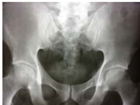
Figura 2 – Radiografía de pelvis. Esclerosis de las articulaciones sacroiliacas.

Los observadores iniciales consideraron un infarto agudo de miocardio con elevación del ST, razón por la cual decidieron trombolizar con alteplase, con mejoría del dolor precordial y disminución del segmento ST en el EKG de control posttrombólisis. Los paraclínicos mostraron: troponina inicial de 2,88 ng/mL (positiva >0,5); segunda troponina de control de 6,53 ng/mL y tercera troponina de 14,7 ng/mL. El ecocardiograma TT mostró una cardiopatía hipertrófica concéntrica y miocardio hiperdinámico. FEVI: 70%. Hipoquinesia leve inferior. PSP: 33 mmHg. Aurículas normales. Leve dilatación de la aorta ascendente. Fue llevado a angiografía coronaria, donde reportaron arterias coronarias sin lesiones. Durante su