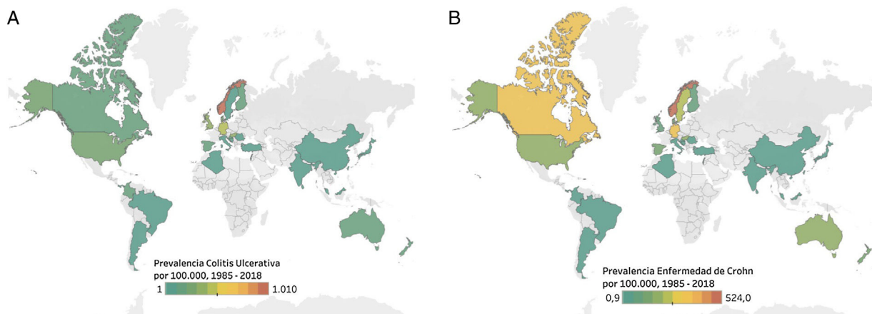
Figura 2 – Prevalencia de la enfermedad intestinal inflamatoria en el mundo. A) Enfermedad de Crohn. B) Colitis ulcerativa 1,8,10-14,19 .

la prevalencia e incidencia se ha logrado probar a partir de trabajos como el desarrollado por Molodecky et al., quienes muestran que las tasas más altas se encuentran en las naciones más desarrolladas, como es el caso de los países