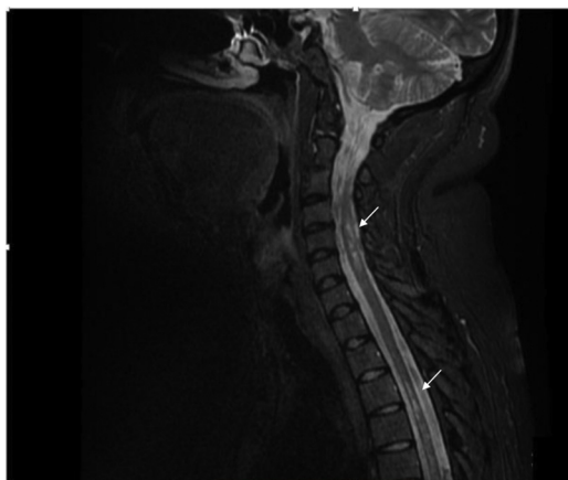
Figura 2 – RM secuencia T2 que presenta imágenes focales hiperintensas a nivel del cordón medular de ubicación predominantemente lateral de distribución difusa en columna cervical y dorsal (flechas).

Durante la hospitalización, la paciente evoluciona rápidamente, presenta dolor neuropático y el nivel sensitivo empeora hasta T6. Se realiza IRM cerebral contrastada y se hallan múltiples imágenes focales paraventriculares y corticosubcorticales con hiperintensidad en secuencia FLAIR, sin realce posterior a la administración del medio de contraste IV ni restricción en secuencias de difusión (fig. 1).