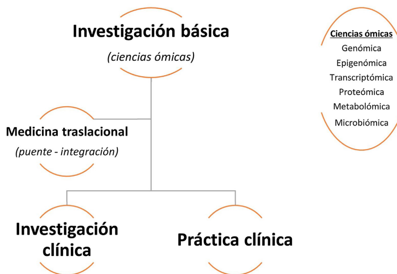
Figura 1 – Modelo de organización integrativa de la medicina traslacional.

Por todo lo anterior, surge una imperiosa necesidad de información desde las ciencias básicas que aclare muchos aspectos aún desconocidos en las enfermedades autoinmunes y acerque de manera directa el conocimiento básico a la práctica clínica 1 . De ahí surge la medicina traslacional y sus aproximaciones multiómicas que en su estructura fundamental (fig. 1) llegan a fortalecer el conocimiento en reumatología y su práctica clínica, toda vez que su objetivo es “trasladar” de manera directa y preferencial lo hallado en estudios biológicos básicos hacia el campo de la medicina clínica,