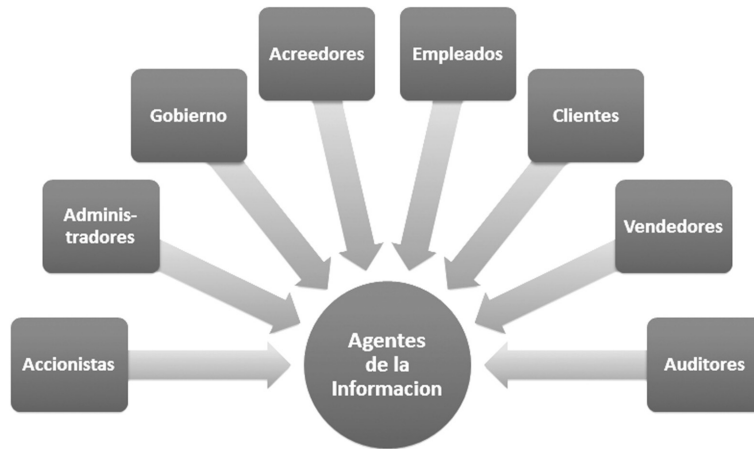
Figura 1. Agentes de la información