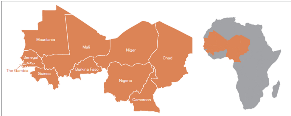
Figura 1. La Región del Sahel

La región del Sahel enfrenta situaciones de corrupción, impunidad, gobiernos poco eficaces o vacíos legislativos que favorecen el desgobierno y, por ende, el surgimiento de Estados fallidos o débiles (Skaperdas, 2001; Emerson & Solomon, 2018; Zapata, 2014). A estos problemas se suman factores como el excesivo crecimiento demográfico (Leshabari, 2021; Mora, 2017), dinámicas migratorias intrarregionales e intercontinentales (IOM, 2022; Beauchemin 2018; Anguita & González, 2019a), urbanización descontrolada (Van Noorloos & Kloosterboer, 2018; Saghir & Santoro, 2018), fronteras porosas (Sasaoka et al., 2022), y actividades como el terrorismo y tráfico ilícitos, en particular el narcotráfico (Sampó, 2019; Wood & Danssaert, 2021). Estos desafíos agravan la crisis social, económica y política de la región.