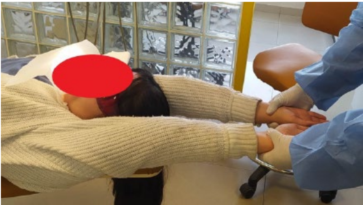
Figura 1. Evaluación de la cintura escapular

La cintura escapular se evaluó por el largo de los brazos. Para ello el investigador se ubicó por detrás del sillón dental; tomó las muñecas del paciente entre el dedo pulgar, el índice y el medio, y tiró ligeramente los brazos de manera simétrica en el plano sagital. A fin de asegurarse de que la posición del paciente sobre el sillón no provocara algún error del test, se le pidió relajar los brazos. La maniobra debe ser lo suficientemente firme y rápida, y si la cintura escapular está horizontal, los maléolos radiales estarán paralelos (figura 1).