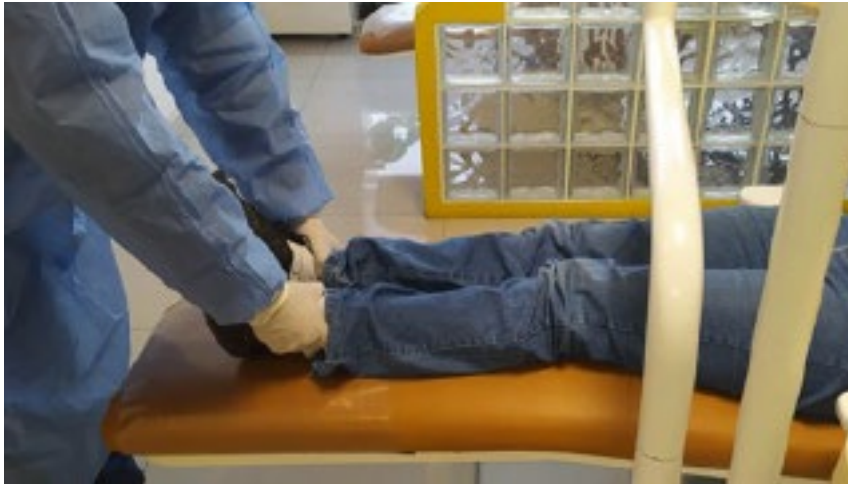
Figura 2. Evaluación de la cintura pelviana

Para la evaluación de la cintura pelviana en la misma posición de inclinación de 180° del espaldar del sillón dental se verificó que el paciente estuviera cómodo, derecho, con las piernas paralelas y relajadas sin hacer tensión. El investigador se ubicó por delante de los pies y con los dedos de las manos rodeó los tobillos, ubicó los maléolos tibiales (parte más prominente) y verificó su posición para determinar si estaban paralelos o en el mismo nivel. Así se consideró alineada la cintura pelviana o, por el contrario, se consideró no alineada (figura 2). Ambas evaluaciones se realizaron con la boca entreabierta y sin contactos oclusales.