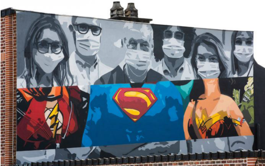
FIGURA 4 | Mural en homenaje a los trabajadores sanitarios en Sint-Martens-Lennik, Bélgica

Fuente: Une fresque de street art (2020).