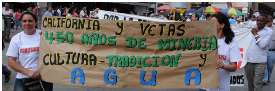
FIGURA 2 | Minería y agua en armonía. Marcha realizada en marzo de 2011