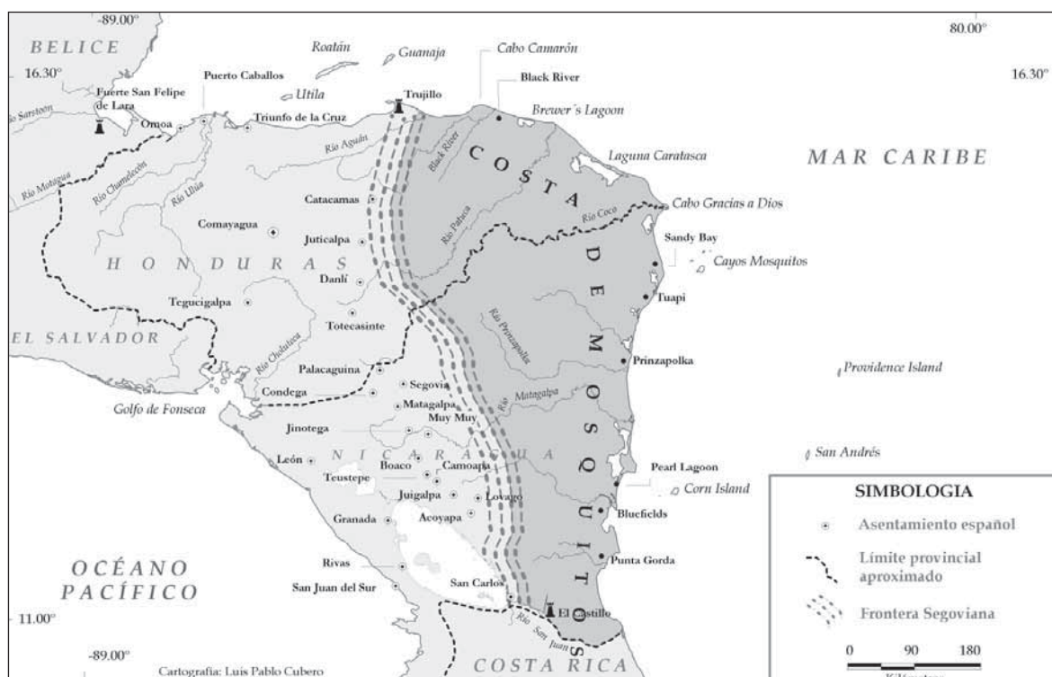
COSTA DE MOSQUITOS Y REGIONES ADYACENTES, SIGLOS XVII-XVIII

de los zambos mosquitos, y defender las posesiones españolas de la costa del pacífico de Nicaragua. Este borde poroso de la Mosquitia lo denominamos la frontera segoviana, constituida por asentamientos españoles de distinta naturaleza, como, por ejemplo, pueblos de montaña, y en los límites sur y norte, por puestos fortificados como el Castillo del Río San Juan y el puerto de Trujillo, respectivamente. Esta frontera se extendió desde el Castillo del Río San Juan, pasando por los pueblos de Acoyapa, Lóvago, Juigalpa, Camoapa, Boaco, Muy Muy, Matagalpa, Jinotega, Condega, Segovia, Palacaguina, Totecasinte, Danlí, Juticalpa, Catacamas y Sonaguera, hasta Trujillo en el Caribe hondureño (Ibarra R., 2006).