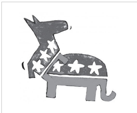
Demócratas vs Republicanos, Chócolo

Chócolo: El humor y su expresión plástica.