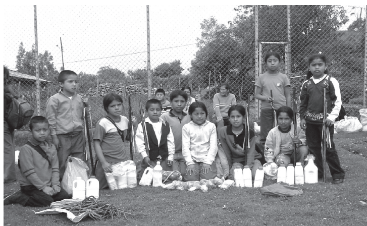
Foto 3. Niños indígenas de la localidad de Pululó (resguardo de Puracé), en el trueque realizado en Puracé en noviembre de 2006