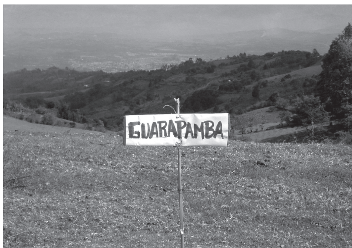
Foto 2. Localización de resguardos de clima cálido y templado. Trueque organizado en Poblazón, julio de 2006 (al fondo, Popayán)