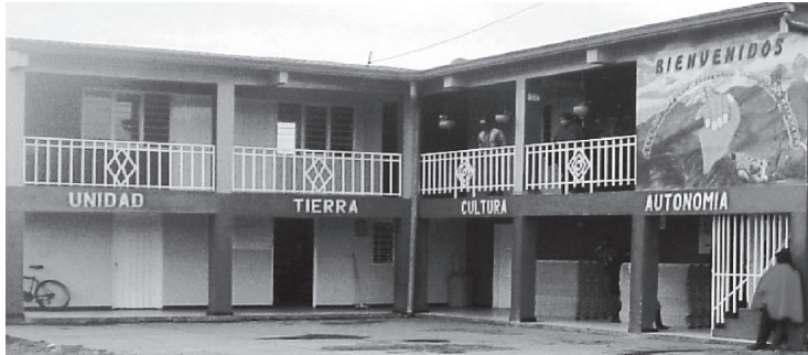
Fotografía de Jairo Tocancipá-Falla, 2006.