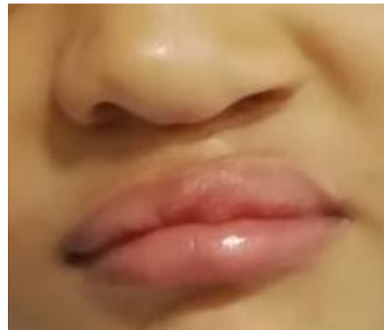
Figura 4. Foto actual de la paciente con 2 años 10 meses.

alimentándola, de manera que a los dos meses ya contaba con 5 Kg de peso. Se inició el tratamiento el 10 de febrero del 2017 y terminó el día 25 de agosto del mismo año. Un mes después fue realizada la Queilorrafia, precisando que la paciente no utilizó dispositivos moldeadores nasales posquirúrgicos. (Figura 4).