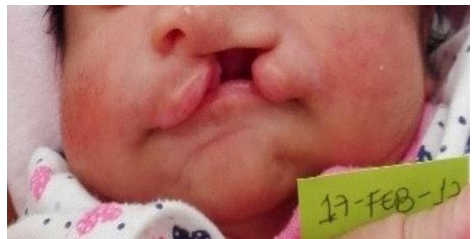
Figura 1. Paciente en cita inicial. Se observa labio y paladar hendido unilateral izquierdo completo.

El caso es de una paciente femenina de 17 días de nacida, que asistió a consulta presentando labio y paladar hendido unilateral izquierdo completo, sistémicamente sana, con antecedentes perinatales de riesgo, en relación con el desarrollo del labio y paladar hendido. En el motivo de consulta la madre afirmó: “Nació con un peso de 3,620 libras, pero con el pasar de los días este iba disminuyendo por la poca alimentación y me daba temor darle el tetero por miedo a que se ahogara” (Figura1).