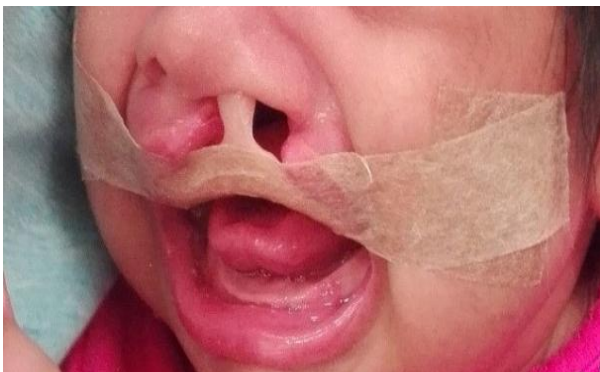
Figura 2. Paciente con placa de ortesis.

La paciente empezó a utilizar la placa, que sirvió para generar confianza en la madre, para seguir