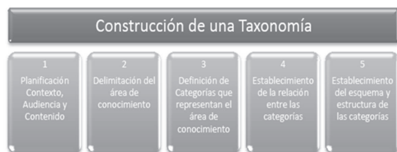
Figura 3 Pasos para desarrollar una taxonomía

automatizan en los métodos de construcción de taxonomías mencionados anteriormente. Por esta razón, en este trabajo se propone el método MECT (MÉtodo para la Construcción de una Taxonomía) que se ha utilizado para desarrollar la estructura de la taxonomía de riesgos propios del outsourcing de software (véase figura 3). Los pasos que componen el método son: