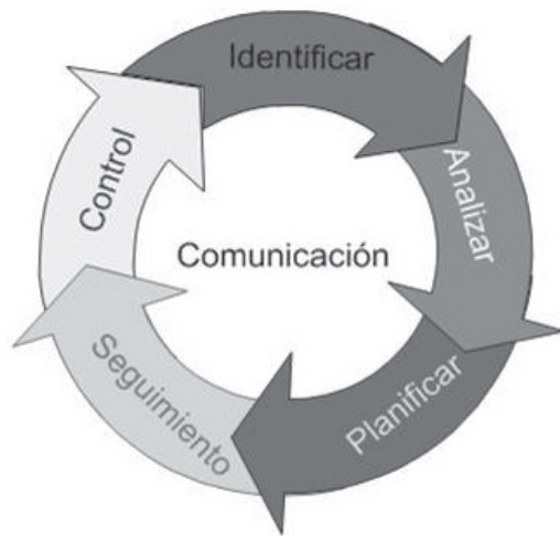
Figura1 Paradigma de gestión de riesgos

Además, existen diferentes estándares y modelos de procesos que tratan el outsourcing, tales como el Software Life Cycle Processes ISO/IEC 12207 [13], el CMMI Acquisition Module (CMMI-AM) [14], el eSCM [15] y el CMMI-ACQ [3]. Todos coinciden en considerar la gestión de riesgos en los proyectos de outsourcing como un proceso clave. El planteamiento de estas propuestas busca proporcionar a las organizaciones, guías, procedimientos, estructuras o modelos para desarrollar adecuadamente los procesos de gestión de los proyectos de outsourcing de software. Enmarcan la gestión de riesgos como un proceso fundamental de la gestión de proyectos, lo que indica que una buena gestión de proyectos, que incluya la gestión de riesgos, permitiría disminuir el nivel de fallos o fracasos en los proyectos de outsourcing de software.